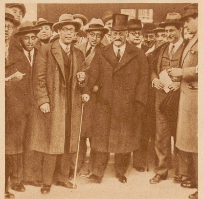
Graf Romanones (mit dem Zylinder), der jetzige Minister für auswärtige Angelegenheiten, verläßt nach der Konferenz mit dem König den Palast