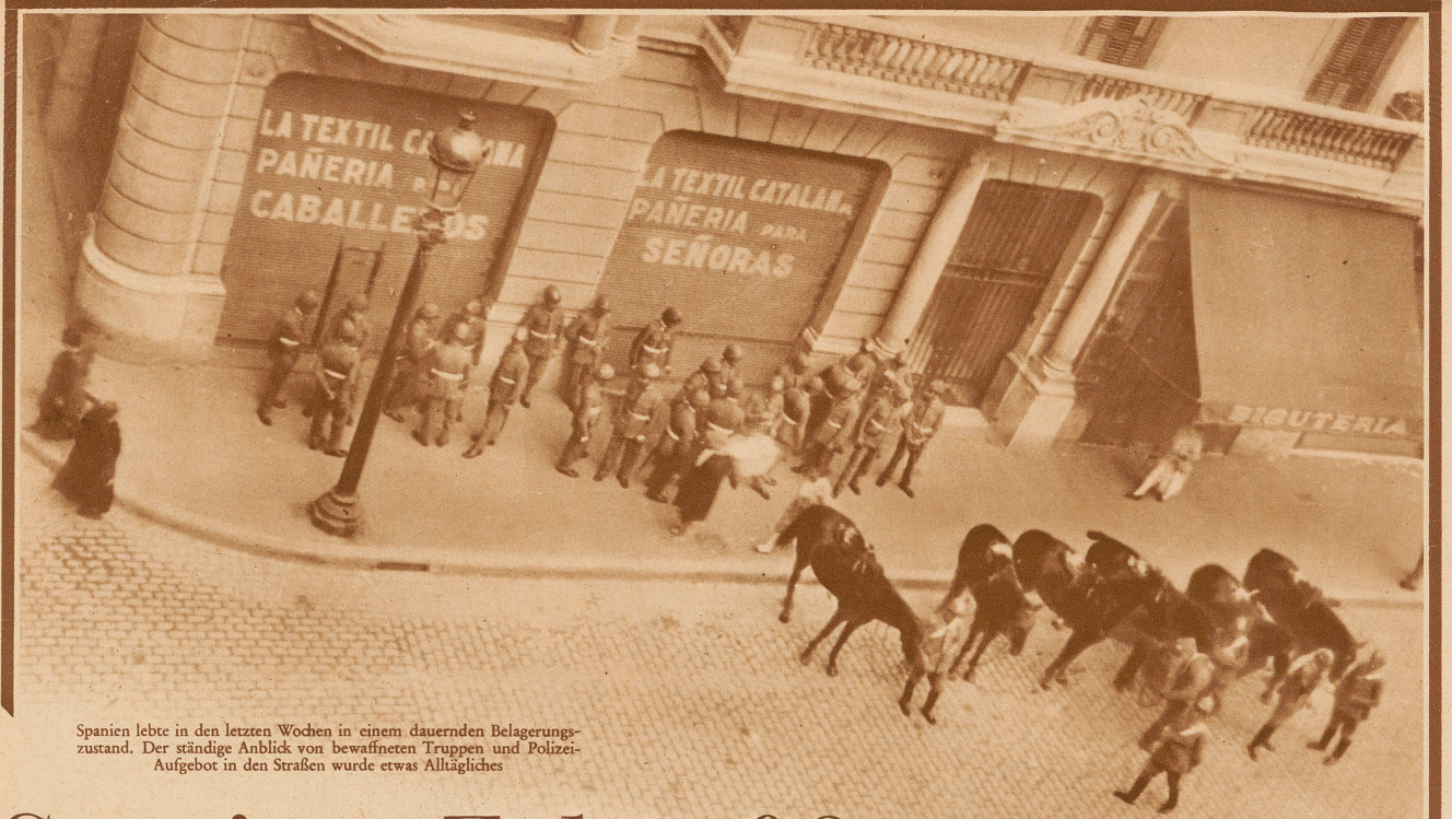
Spanien lebte in den letzten Wochen in einem dauernden Belagerungszustand. Der ständige Anblick von bewaffneten Truppen und Polizeiaufgebot in den Straßen wurde etwas Alltägliches