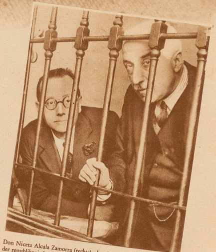
Don Niceta Alcala Zamorra (rechts), der frühere Kriegsminister, hat sich der republikanischen Bewegung angeschlossen, — was bezeichnend für das starke Anwachsen dieser Richtung ist. Die jetzige Regierung geht unerbittlich selbst gegen die gemäßigten Republikaner vor und verurteilt ihre hervorragenden Köpfe mit Vorliebe zu lebenslänglichem Zuchthaus