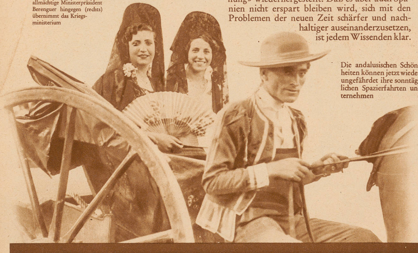
Die andalusischen Schönheiten können jetzt wieder ungefährdet ihre sonntäglichen Spazierfahrten unternehmen