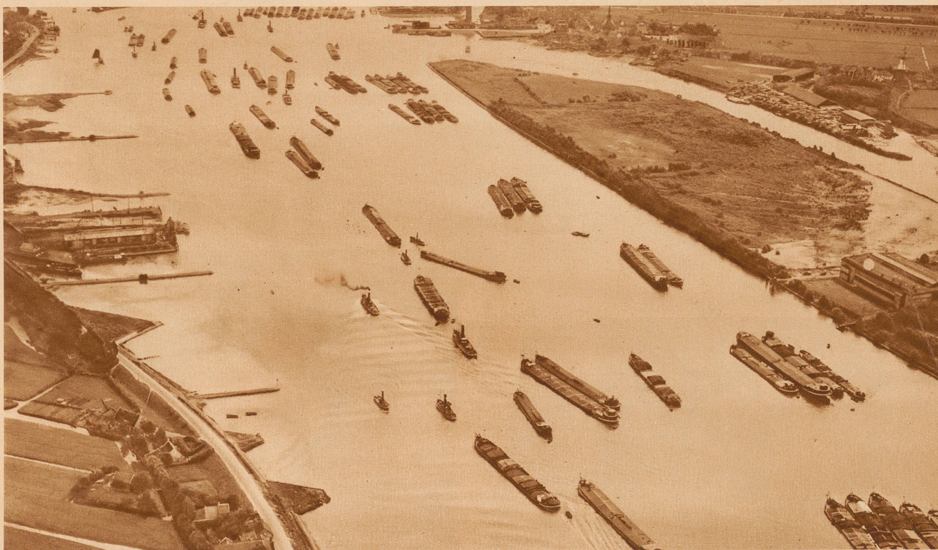
Der Rhein bei Rotterdam, der Schleppkähne und Seeschiffe auf seinem Rücken trägt. Der Fluß ist zu einer Art Patriarch geworden, der nach vielen Erlebnissen ruhig und breit dahinfließt. Hier hat schon die Deltabildung des Rheins begonnen und jeder einzelne seiner vielen Arme führt einen neuen Namen. Unterhalb von Rotterdam heißt er die «Nieuwe Maas»