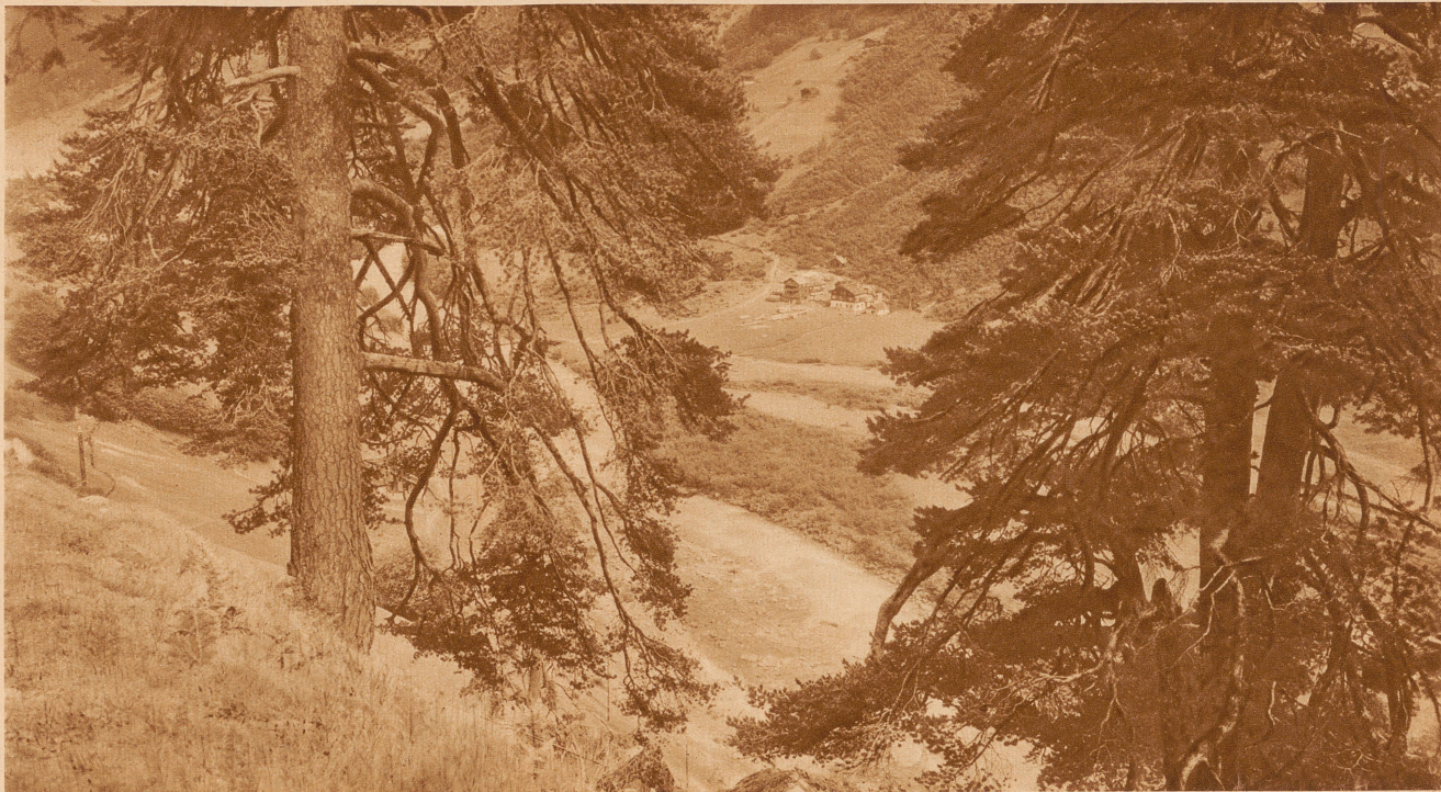
Der junge Rhein bei Campodials in Graubünden: hier hat der Fluß noch sein ganzes reiches Leben vor sich, – mit welcher wilden Kraft schießt er durch sein schmales Bett!

Die beiden Bilder stammen aus dem Schaubuch: «Der Rhein von den Alpen bis zum Meere». Verlag Orell Füßli, Zürich