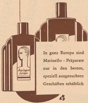
SG 16 B 5

Bitte verlangen Sie von einer der untenstehenden Firmen das Gratis-Büchlein „Marinello-Schönheitspflege“. Danach können Sie feststellen, welche Präparate Ihre Haut braucht. Wenden Sie sie konsequent an — und Sie beschreiten den Weg zur Schönheit!