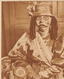
Bild links: Auch in Bern ist am Kursaalmaskenball die «Miß Schweizerland» preisgekrönt worden. Eigentlich hat man sich unsere Schönheitskönigin doch ein wenig hübscher vorgestellt

Neben ihm der traditionelle Narr und ein Mitglied des Zunftvorstandes. Am Fritschiumzug wird er mit anderen traditionellen Figuren im Fritschiwagen durch die Stadt gefahren, nachdem er seine Wohlthatigkeitstournee beendet hat