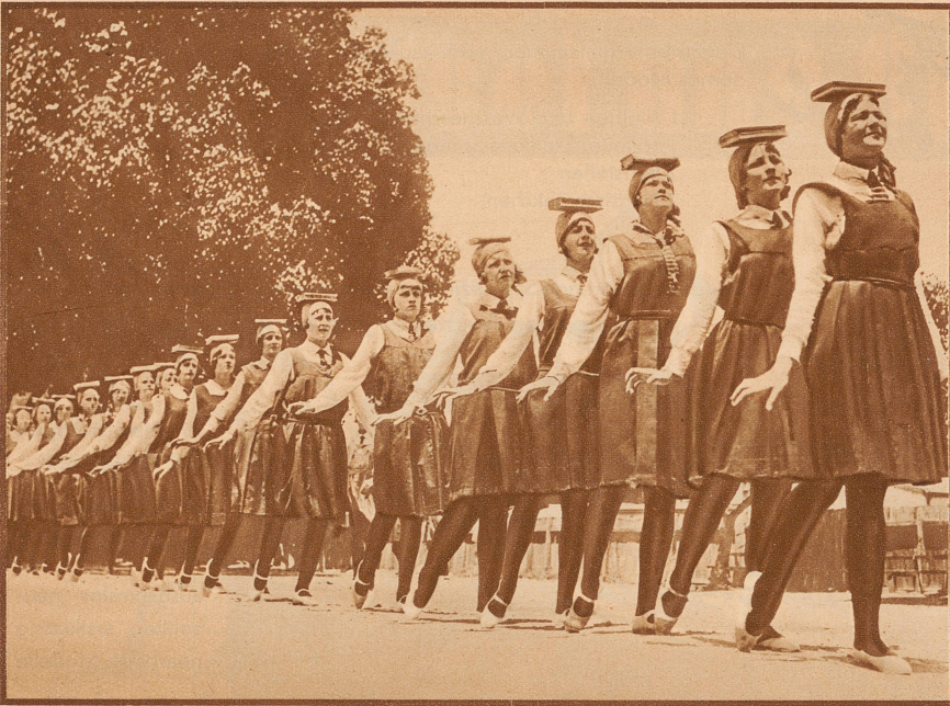
Eigenartige Wege zu Kraft und Schönheit: In australischen Schulen läßt man die Mädchen nach Schluß des Unterrichts Bücher auf dem Kopf balancieren und hofft, sie würden dadurch die harmonische Schönheit sizilianischer Wasserträgerinnen erreichen