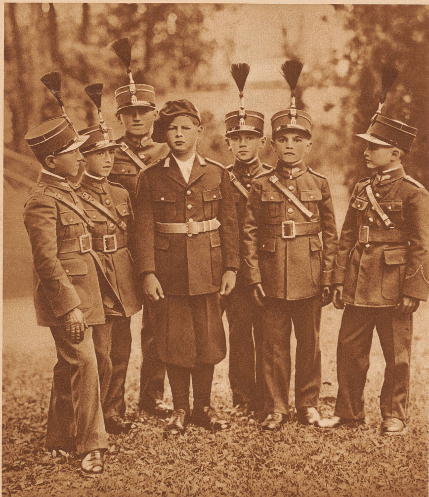
Der kleine Prinz Michael von Rumänien war ein ganzes Jahr lang König in seinem Land, bis sein Vater von Paris heimkam. Jetzt ist er wieder Kronprinz und muß warten, bis er groß ist, bevor er noch einmal König wird. Sein Bild kann man auf allen rumänischen Briefmarken sehen. Hier ist er zusammen mit seinen Klassenkameraden aus der Militärschule. Er muß riesig viel lernen, mehr als er gerne mag, denn er ist ein bißchen dick und faul und hochmütig

Hier ist das Hauptbureau der Kinderbank. Der zweite rechts oben ist der Direktor; er ist dreizehn Jahre alt und nimmt sein Amt sehr ernst und sorgt dafür, daß auch alle andern fertig arbeiten. Hierher bringen die Kinder ihre Ersparnisse — Taschengeld und selbstverdientes Geld —, dann bekommen sie ein Bankbüchlein und eine Sparkasse. Hier können sie sich aber auch Geld ausborgen, wenn sie es gerade dringend brauchen und versprechen, es wieder zurückzahlen. Das ist doch praktisch?