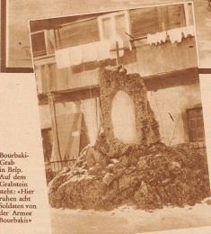
Bourbakis-Grab in Belp. Auf dem Grabstein sieht man die Soldaten der Armee Bourbakis.

Am 1. Februar 1871 betraten die fast 88 000 Mann mit 15 000 Pferden und allen Waffen samt Kriegsmaterial der von den Deutschen umzingelten französischen Armee des Generals Bourbaki bei Verrières, Sainte-Croix und Vallorbes schweizerischen Boden. Ausgehungert, halb erfroren, zerlumpt, in einem schauerlichen