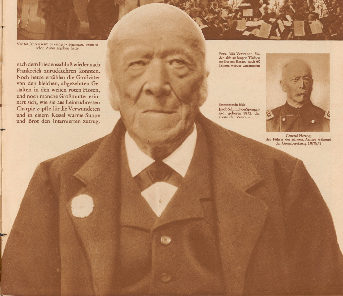
General Herzig, der Führer der schweiz. Armee während der Grenzbesetzung 1870/71