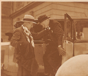
Vor 60 Jahren wie es «erregt» gegungen, wenn es schon Anton gegeben hätte

Sonderausnahmen für die «Zürcher Illustrierte» von P. Senn