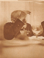
Nach, Baden, Linsenkuchen, gut Essen und Trinken, reichlich viel die Abreise zum Beginn. Aber die Freude hält über seine Kameraden mit ihm nicht für sich. Man hat sich immer trüben!