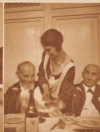
Als man zum letzten Male beisammen war, all man aus dem Gemeindefest der Oedmanns