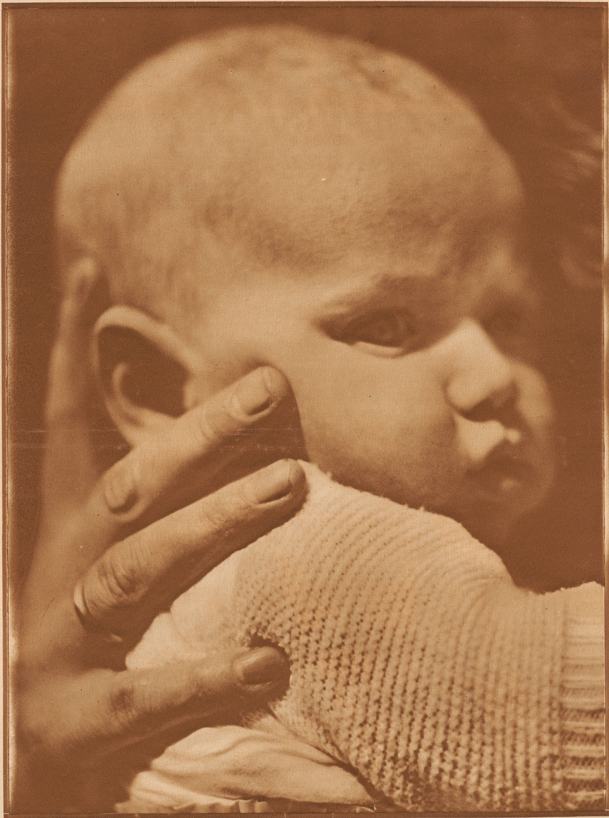
Phot. Hedda Walther Aus «Mutter und Kind» Verlag Dietrich Reimer, Berlin

«Vom sichern Port läßt sich gemächlich - staunen . . . »