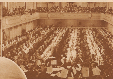
Etwa 300 Veteranen. Ein- den sich an langen Tischen im Berner Kasino nach 60 Jahren wieder zusammen

nach dem Friedensschluß wieder nach Frankreich zurückkehren konnten. Noch heute erzählen die Großväter von den bleichen, abgezehnten Gestalten in den weiten roten Hosen, und noch manche Großmutter erinnert sich, wie sie aus Leintuchresten Charpie zupfte für die Verwundeten und in einem Kessel warme Suppe und Brot den Internierten zutrug.