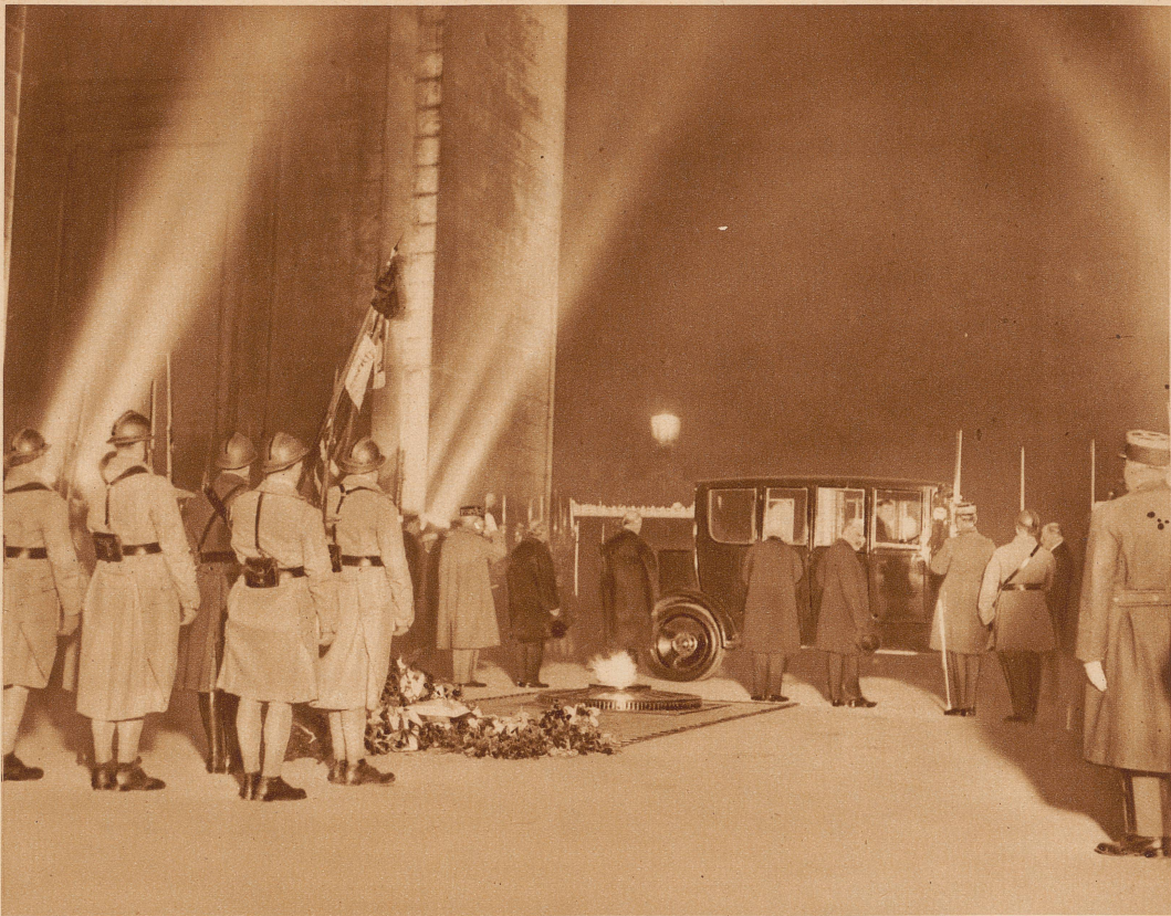
Mit großem Pomp wurden in Paris die Beisetzungfeierlichkeiten für Marschall Joffre durchgeführt. Der Sarg vor dem Grabe des unbekanntes Soldaten unter dem Arc de Triomphe