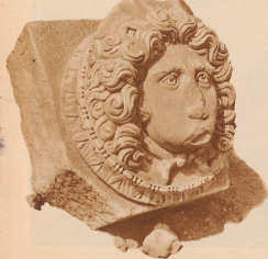
Fast täglich findet man bei den Ausgrabungen solche Kunstwerke

Wenn man die Ruinen des alten Karthago durchwandert, so ist man enttäuscht. Nur stange Gruppen von Säulenstümpfen, die gar keinen Eindruck von einstiger großer Vergangenheit übermitteln können. Hingegen hat der Archäologe dort allein vier Schichten von hoher kulturhistorischer Bedeutung gefunden. — Anders ist es in den weiter südlich gelegenen Städten der einst reichsten römischen Kolonie Nordafrika, in Tunis und Sädgerien, wo manches Bauwerk, in Trümmer sogar der