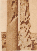
Zwei Säulen, welche über die im Wüstensand verschokene Stadt hinausragen, wurden im Laufe der Jahrhunderte durch die Sandstürme auf die Wüsteneise gänzlich ausgeblüht.