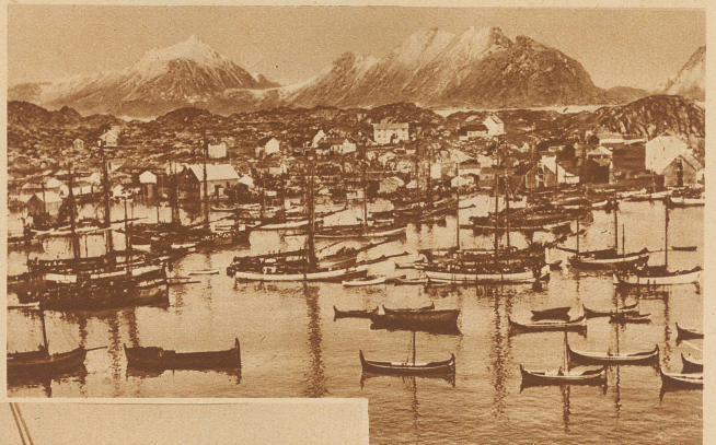
In Bolstad versammelt sich die Lofotenflotte, bestehend aus Fahrzeugen der ganzen norwegischen Küste, um in die Eismergewässer zum Fang auszuziehen