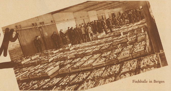
Fischhalle in Bergen

daran das nördliche Eismeer so überaus reich ist. Kommt man ein wenig später, so zu Ende April etwa, in diese Gegenden, dann hat man Gelegenheit, dieses «Gold Norwegens» in nie geahnten Massen längs der weitverzweigten Küste angehäuft zu sehen. Wohin das Auge blickt, Fische, Fische und immer wieder