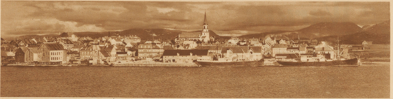
Bodo, ein Städtchen an der nord-norwegischen Küste, der Schauplatz des Lofoten-Fischfangs