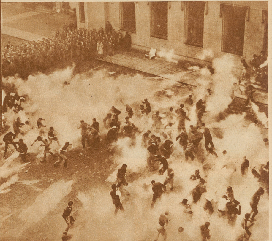
Studentenkampf an einer englischen Universität. Dieser eigenartige Brauch steht mit dem Rektoratswechsel im Zusammenhang. Die beiden Parteien bewerfen sich mit faulen Eiern, mehlgewüllten Papierballen etc. Nicht selten artet die harmlose Schlacht in Schlägereien aus