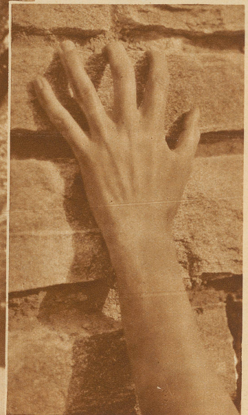
Greifende menschliche Hand