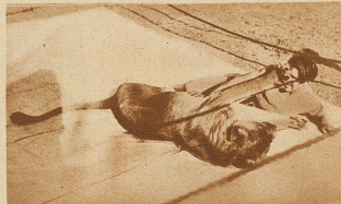
Ringkampf zwischen einem Löwen und seinem Wärter für einen Film in Los Angeles

In Warschau sind Anhänger Pilsudskis in das Parteilokal der national-demokratischen Oppositionspartei eingedrungen und haben dort, ohne von der Polizei gehindert zu werden, die ganzen Einrichtungen zerstört (oberes Bild). Das untere Bild zeigt die Straße vor dem zerstörten Parteilokal mit der heruntergeworfenen Wahlmaterie