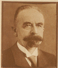
Architekt Jak. Rehfuß in Zürich

ein in weiten Kreisen bekannter Bau- fachmann, der 25 Jahre lang als Lehrer für bauliches Zeichnen und Formen- lehre an der Gewerbeschule der Stadt Zürich lehrte, starb im Alter von 71 Jahren