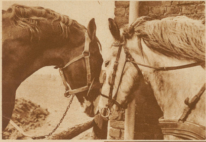
Ein wichtiges Geheimnis