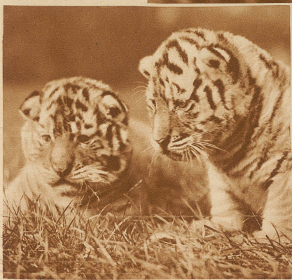
Vier Wochen alte Tigerbabys. Sie tun, als hörten sie das Gras wachsen