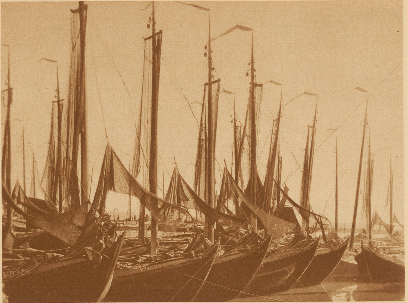
Fischerboote im Hafen von Voolendam, Holland