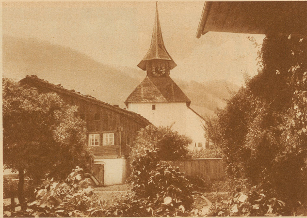
Die unbekannte Schweiz IV. Im Bernbiet, zwischen Thunersee und Stockhornkette, an schützenden Berghang gelehnt, liegt das Dorf Reutigen. Sein schmuckes Kirchlein, einst eine Wallfahrtsstätte, hat sich gleich zwei Helme über den Turm gezogen, um ihn gegen die bösen Wetter zu schützen. Das dunkelgebräunte Holz der Häuser ringsherum strahlt cietel Wärme und Behagen aus. Ein ländliches Idyll, wie es der Traum eines jeden schweizerischen Ausstellungsdorfes wäre

Dieses Geld, es ist das letzte im Hause, schickst du dem Anstaltsdirektor, damit er ihm etwas geben kann, wenn es ihm wieder schlecht geht. Geld, versprich es mir. Denn schau, er kann nichts dafür, daß er so ist. In der Zeit war eben