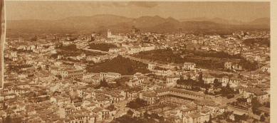
Zigarennensüchtigen Dingen. Zerfallene Besatzungswohnungen der Salzenkrieger dieser: heute noch die Schicksalswinkel für Bettler und Zigeuner.

Die Alhambra, die auf einem imposanten Hügel der Stadt Granada erbaut wurde, ist das herrlichste Kleinod, das Spanien seinen Besuchern zeigen kann. Wer dieses Kulturdenkmal sehen durfte, hat Unvergessliches erlebt und träumt immer wieder von Rückkehr. Sein bedeutendster Schöpfer und Baumeister, Mohammed V, war nicht bloss ein Kulturwerk geschaffen, er lebte, das schmerzlich noch überleben werden kann. Kaiser Karl V., der einen noch imposanteren Palast neben der Alhambra bauen wollte, erlitt bei seinem Verzicht vollständig Scheitern. — Obige Bild zeigt den kriegsgeschickten Kaiser, in dem 1492, während der Eroberung der Alhambra durch Ferdinand und Isabella der erste Dankgedächtnis abgehalten wurde.