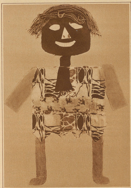
«Manöggel» als Klebearbeit eines 9jährigen Mädchens

Klebearbeiten. Die Abende werden wieder länger. Da sitzt manches von euch hinter dem warmen Ofen und weiß nicht recht, was es machen soll. Habt ihr schon Klebearbeiten probiert? Das ist etwas ganz Vergnügtes und macht jedem, der es probieren will, Freude. — Die Bilder oben sind Photographien von solchen Klebearbeiten, die zwei Mädchen gemacht haben, die in die dritte und vierte Klasse gehen. Die Mutter gab ihnen viele kleine Stoffresten, die sie nicht mehr brauchte, dazu Wollfäden, farbige Papierschnitzel und noch vieles andere mehr. Daraus machten die Mädchen nun «Manöggel» und klebten sie auf ein festes Stück Papier, wie es ihnen gerade gefiel. Aus den Papierschnitzeln wurden Arme und Beine, aus den Stoffresten Kleider, Schürzen und Krawatten, aus den Wollfäden Haare und Schnurrbärte — alles was sie nur haben wollten. Wenn man erst einmal angefangen hat, so fällt einem vieles ein. Probiert es auch, ihr werdet es lustiger und schöner fertigbringen, als wenn euch die Großen diese Klebearbeiten vormachen.