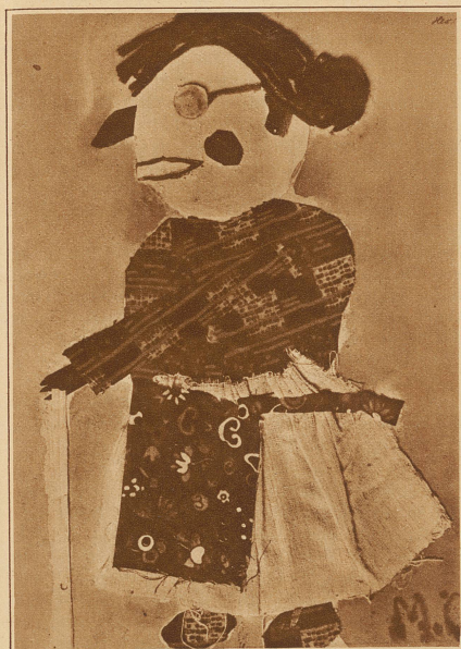
Die Hexe. Klebearbeit eines 10jährigen Mädchens: aus Wolle, Stoffresten, Papierabfällen und Stroh