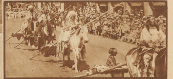
Die Indianer kommen von den Reservaten herein in die Stadt, Alles in Calc, mit einem Zelt. Die Truppen kreuzen sich über dem Hals des Pferdes; hinten trägt eine Quersäge die Zelt und die Reiter Mädeln