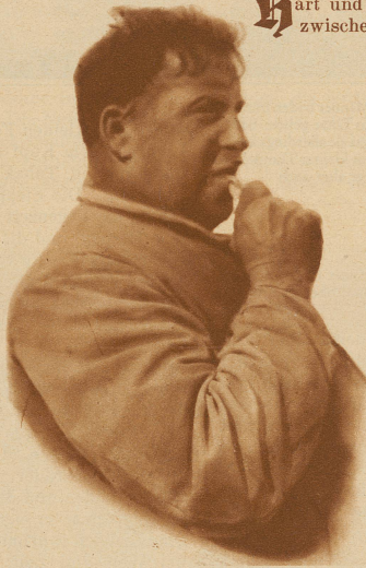
Bild links: Der Chefmonteur, ohne dessen Pflichten auch hundert stärkste Männer kein Kabel vorwärtsbringen

wandeln kann? Dem wißbegierig Weilenden schält sich aus dem Chaos von ausgebrochenem Asphalt und grabenden Menschen, von Erde und Schubkarren, von Röhren und Kabeln die Seele der Straße. Die Seele der Straße — ist das nicht der Mensch? Nein, das ist das Kabel. Da wird es vom großen Haspel, der «Bobine» abgerollt und im Gleichtakt kräftiger Arme in die Tiefe der Straße gebettet. Wohlbehütet in den Rillen eines Betonlagers, von Papier sorgsam umwickelt und in wasserdichten Bleimantel gehüllt, liegt sie nun da — die Kabelseele aus Kupferdrähten. Wehe, wenn ein Stümper sie verwirrt! Bei einigen Tausend Volt Kurzschluß — ein tragisches Ende! / Drum, schielt die aufgerissene Straße nicht! Bald zieht sie sich wieder hart und verschlossen zwischen den grauen Häusern hin.