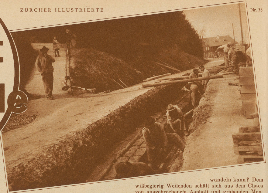
Bild, rechts: Ein Pfiff — und im Gleichtakt kräftiger Arme wird das Kabel einen Ruck vorwärts- geschoben

H art und verschlossen zieht sich die Straße zwischen grauen Häusern hin. Wie langweilig, wenn kein ratterndes Vehikel sich auf ihr austobt und kein ängstlicher Fußgänger sie überschreitet! Wer denkt daran, daß unter ihrer glatten Oberfläche geheimes Leben pulsiert? Da kommen Männer und reißen die Straße auf. Vorsicht Baustelle! Straße gesperrt! Soll sich der Mensch ärgern, wenn jetzt eine Straße ihre Geheimnisse lüftet? Braucht sich der Fußgänger zu ärgern, der keine offenen Gräben überspringen muß, sondern mit einem Geländer zur Hand über saubere Bretter