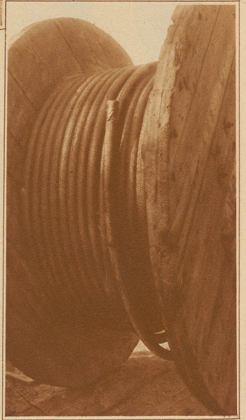
Text und Aufnahmen von Hans Staub