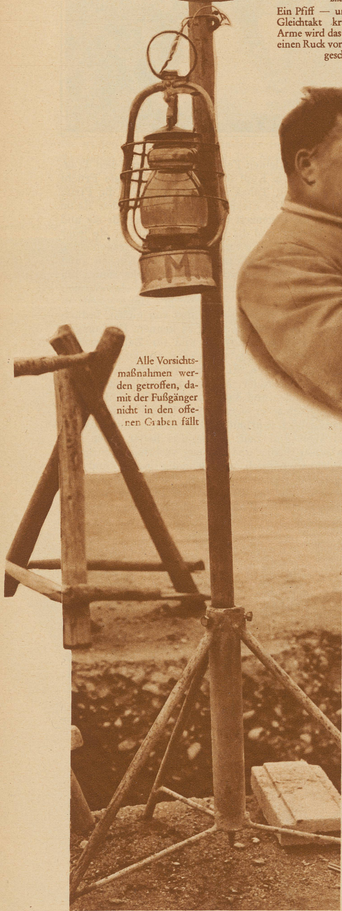
Alle Vorsichts- maßnahmen wer- den getroffen, da- mit der Fußgänger nicht in den offe- nen Gräben fällt