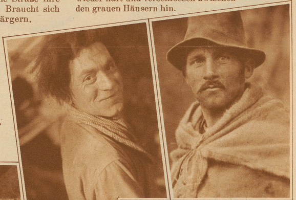
Zwei Kabelmän- ner bei derselben Arbeit, aber nicht mit denselben Gesichtern