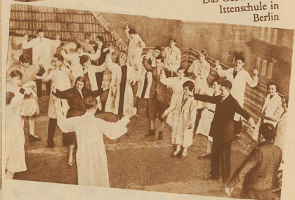
Auf dem Dach der Ittenschule. Mit angespannten Muskeln und verkrampften Gebärden läßt sich nicht zeichnen. Die entspannte Hand, entspannter Arm und Körper sind Voraussetzung für den Zeichenstrich, welcher dem Wesen des Zeichnenden entspringen soll. Übungen zur Entspannung der Muskeln finden vor Beginn der Unterrichtsstunden auf dem Dach des Schulgebäudes statt