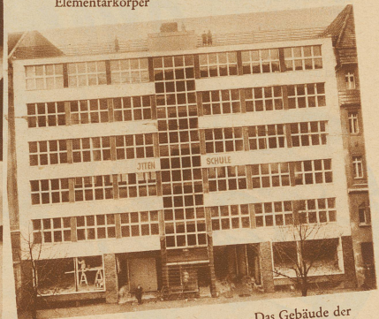
Das Gebäude der Ittenschule in Berlin