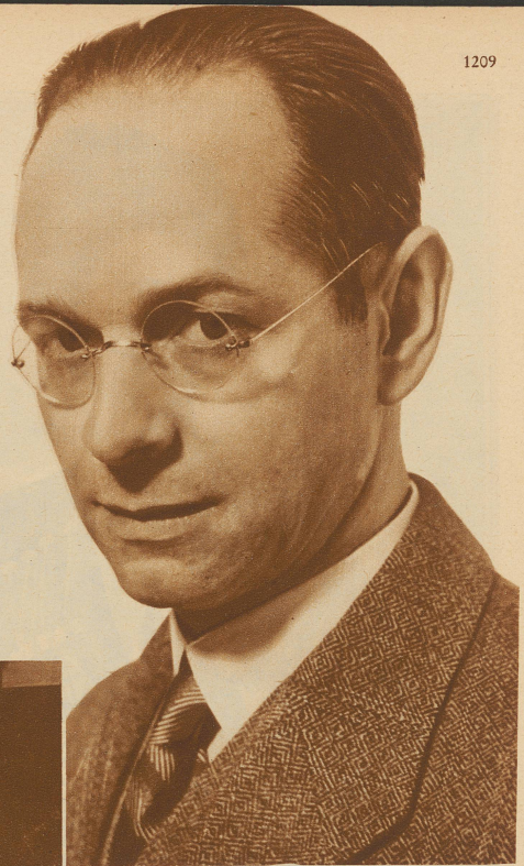
Prof. Johannes Itten