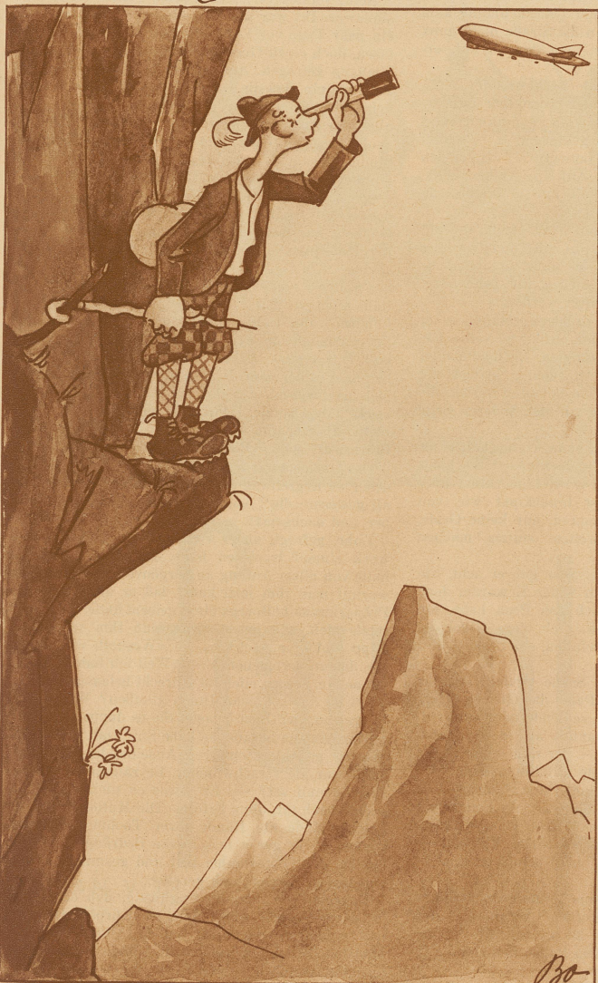
«Ich wett glich nonig mit em Zepp fahre, me chönti halt doch emal obe-n-abe gheie!»

Ebeliche Szene in Grinzing. «Franz! Monatlang hast mir an neuen Huat versprochen zum Herbst. Der Herbst ist da — und was hab ich auf'm Kopf? An Dreck.»