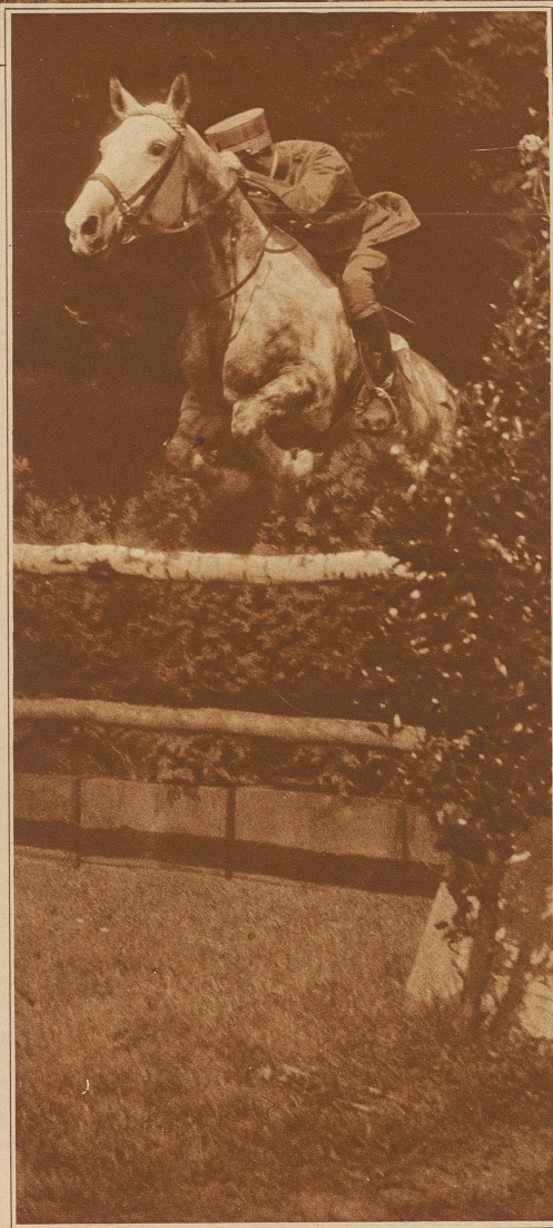
Frau A. STOFFEL ritt ihren Schimmel «Liebling» im Preis vom Bürgenstock zum Siege, fast 60 weitere Konkurrenten und Konkurrentinnen aus 8 Ländern hinter sich lassend