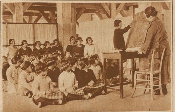
Klasse einer Waisenschule