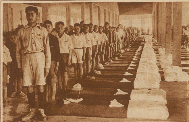
Schlafsaal in einem Heim in Syra, einer Insel im Aegäischen Meer

Es gab einen Augenblick, wo das heutige Griechenland mit seinen 5 Millionen Einwohnern elend und erschöpft darniederlag, und in dieser denkbar