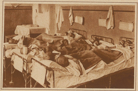
Der Andrang war eine Zeitlang so groß, daß man 3 und 4 Kinder in ein Bett legen mußte