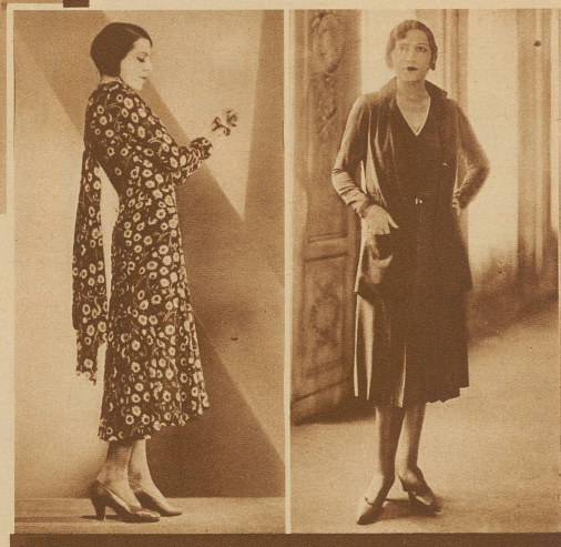
Die Margueritenwiese auf dem Nachmittagskleid. Modell Drecoll-Beer, Paris