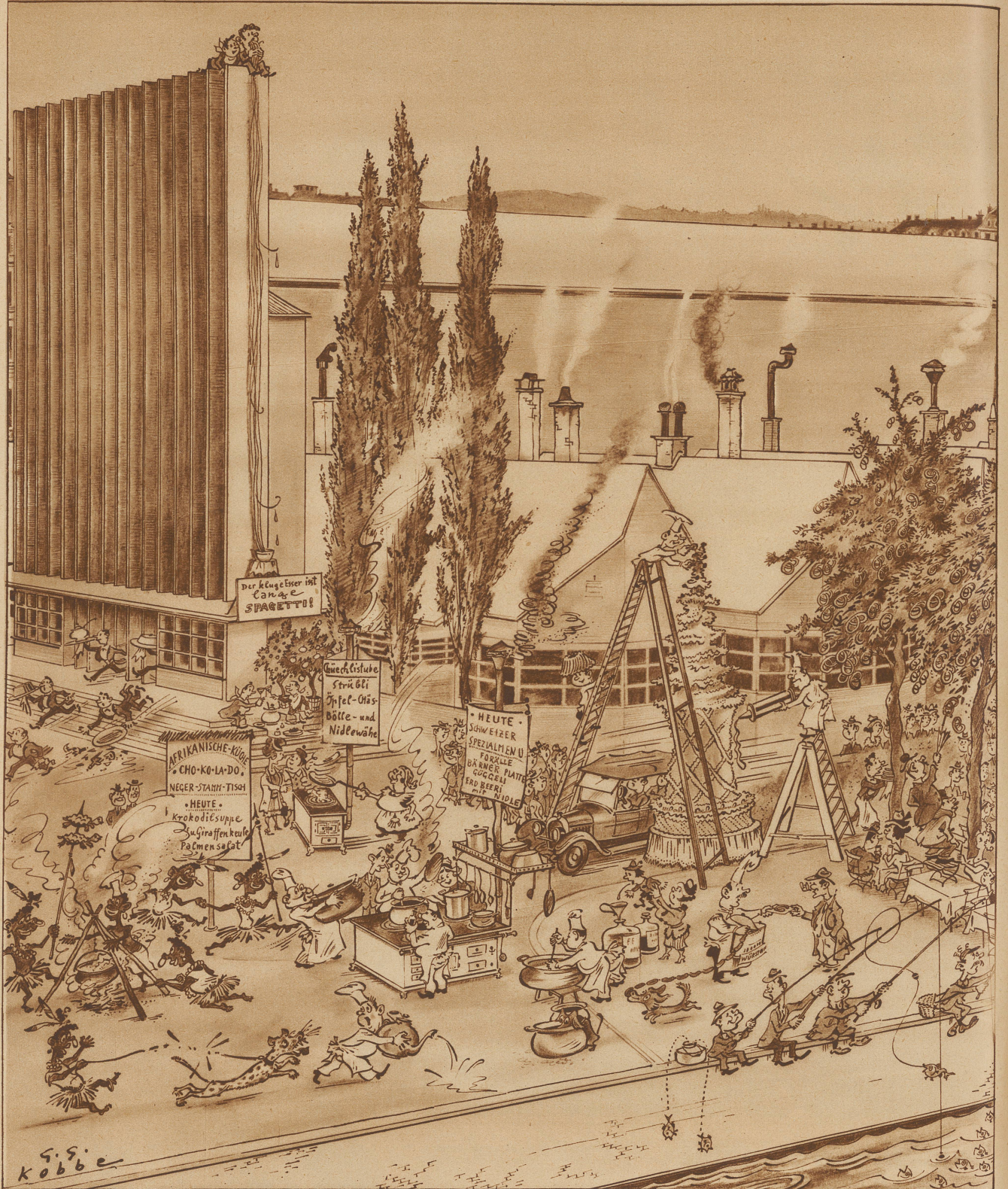
Für die 'Zürcher Illustrierte' gezeichnet von G. G. Kobbe

Setz den Topf weg, mein Schatz, komm zum Bellevueplatz, bei der Zita laß draußen uns heute mal schmausen;