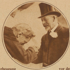
Die Verbeugung vor dem König. Der Direktor des Haymarket Theaters empfängt den englischen König bei seiner Ankunft im Theater, wo er einer Aufführung des «Hamlet» bewohnt.