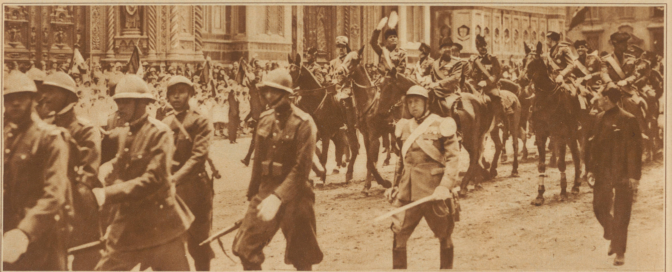
Mussolinis Einzug in Florenz an der Spitze von 20 000 Soldaten. Bei diesem Anlasse hielt der Duce eine kriegsgerische Rede, in der er erklärte, daß Worte zwar etwas Schönes, aber Gewehre, Maschinengewehre, die Schiffe, Flugzeuge und Kanonen noch etwas viel Schöneres seien