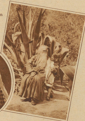
Bild links: Der indische Dichter Rabindranath Tagore mit seiner Enkelin Nandini