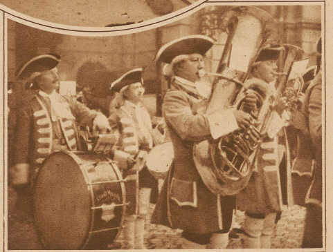
Die Stadtmusik mit Zopf und Dreispitz