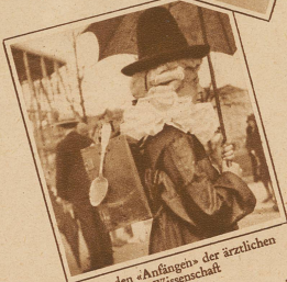
Aus den «Anfängen» der ärztlichen Wissenschaft