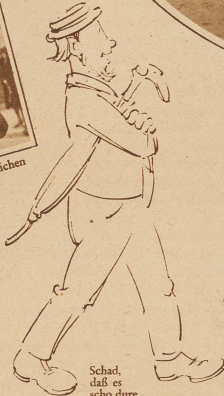
Schad, daß es scho dure isch. I meine, ich well nochli hinder der Musik härmarschiere

«Sie, do vorne, chöntet Sie nid wenigstes de Huet abtue. Die hindere gsehnd ja nit. Sie! Ghored Sie nit?!» «Wäge-me Bögg tuen ich de Huet nid ab», hät de Gigertheiri gseit.