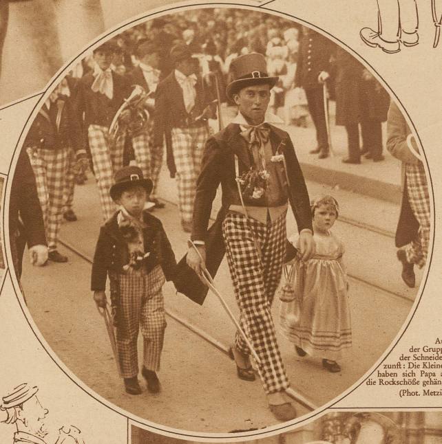
Aus der Gruppe der Schneiderzunft: Die Kleinen haben sich Papa an die Rockschiße gehängs