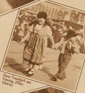
Zwei Tessinerli am Umzug