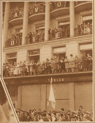
Wie de Gigerliheiri das Savoy-Hotel gesehen hat