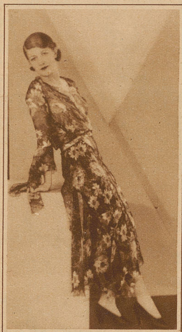
Blumenbedruckter Seiden-Mousseline (Modell Augusta Bernard)