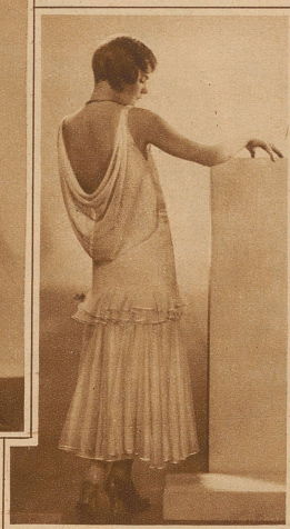
Bild rechts: Einfaches Nachmittagskleid aus ganz schwerem Crêpe Marocain. (Modell Bernard & Cie.)