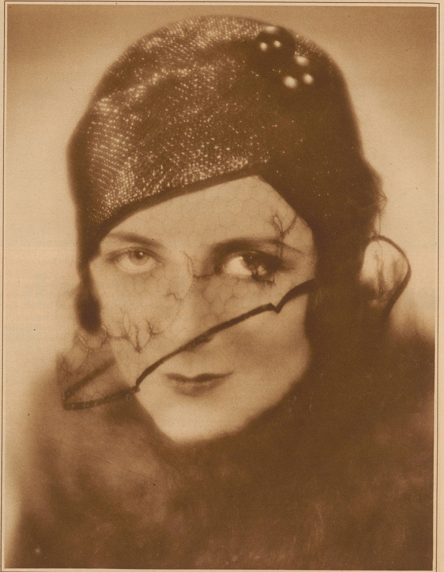
Bild rechts: Toque in schwarzem Hochglanzstrob mit fei- nem Halbschleier

Immer neue, Eleganz erhöhende Dinge hat man erfunden: Zwillingstoffe für Mäntel und Kleider im gleichen Wollmaterial, nur für letztere um einige Grad leichter; Manteltweeds mit Uniabseite, die ungefüllt verarbeitet und über im Ton gehaltenem Kleidstoff getragen werden. Auch die diesmalige große Shantung-Vogue hat ihre Spezialitäten. Neben Rohseide unterscheidet man den etwas schwereren