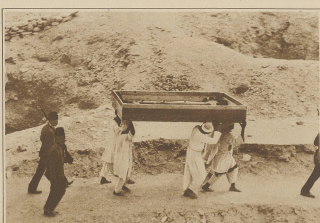
Die Mythen des Paracelsusgrabs. Transport eines Leichnams aus dem Grabe Turin-Grabs unter ständiger Begleitung