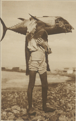
Ein prächtiges Exemplar eines auf den karaischen Inseln gefangenen Theilfisches