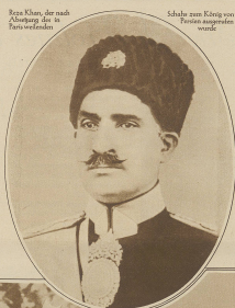
Reza Khan, der nach Abkündigung des in Persien verbliebenen