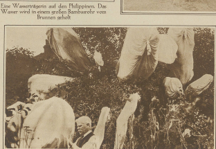
Ein Wassertrinken auf den Philippinen. Das Wasser wird in einem großen Bambusrohr vom Brunnen geholt