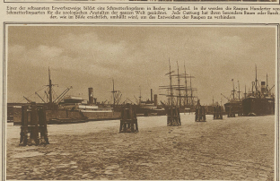
Blick auf den vereisten Segelschiffhafen von Hamburg, dessen Verkehr durch das viele Treibeis betrüblich vollständig behindert wurde