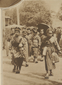
Japan. Japanische A. B. C. - Schützen auf dem Wege zur Schule. Man beachte die eigenartige Fußbekleidung