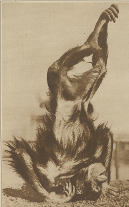
Dem Rassen «Orange-Lige» «Kongul», die Leuchtener freigelegten Urtieren geht es so gut, daß er von Vorposten auf dem Berge steht