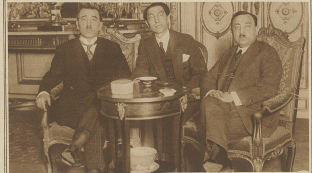
Zum englisch-russischen Konflikt. Eine Unterredung des russischen Botschafters (Frank Rowley bei 1889) mit dem britischen Botschaftssekretär von London und Paris