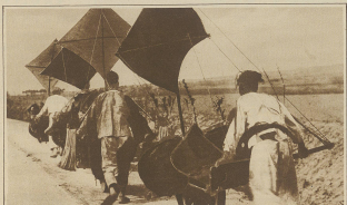
Spielereien in China. Um sich die Arbeit zu erleichtern, haben die chinesischen Kofler ihre Karren mit Stroh gefüllt, die bei den durch den Verkehr verursachten Witterungsbedingungen vorzügliche Dämme bilden