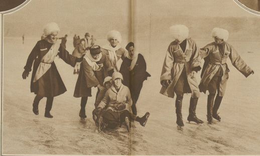
Russische Emigranten in typischer Kowakuniform versetzen sich bei Leningrad