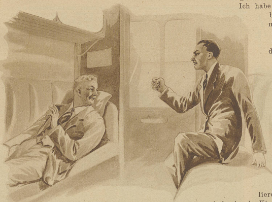
«Sie sind ein Schuft!»

Es gibt Menschen, die schon auf den ersten Blick ungemein sympathisch wirken und denen man sofort das größte Vertrauen entgegenbringt. Alles ist ihnen gegeben: eine angenehme Stimme, gute Manieren, ein klarer, offener Blick. ... Ist es denn nicht selbstverständlich, daß all dies zu einer freundschaftlichen Aufrichtigkeit aufmuntert?! — Wenn wir die Bekanntschaft eines solchen Menschen gemacht haben, so erwacht in uns nach kaum einer Stunde das Gefühl, als ob wir ihn lange, lange Jahre schon kennen. — Auch mir passierte einst, daß ich eben mit einem derartigen Menschen zusammengetroffen bin, und lange noch wird mir die Erinnerung an ihn bleiben.