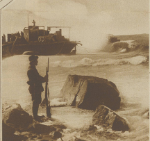
Der Fiskus in Mischko. Wapentzen bei einem Meer an der Küste von Chios