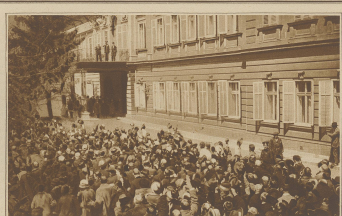
Zum griechisch-türkischen Konflikte. Das Volk huldigt dem Zaren vor dem Palast in Sidon