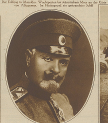
General Lazare, der Oberbefehlshaber der bulgarischen Armee