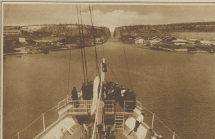
Der Kanal von Kani, der an dem ersten Kanaleskanal nachgebaut wurde, ist nun wieder soweit in Ordnung gestellt, dass er für die Schiffe für größere Schiffe nutzbar ist. Linien der Kanaleskanal