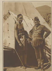
Die plenipotentiären. Der griechische Plenipotentiär (links) und der französische Plenipotentiär (rechts) während der Verhandlungen in Athen