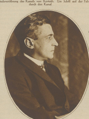
General Pando, der Führer der türkischen Truppen