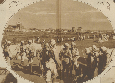
Zum Dreimächteabstand in Syrien. Bild auf Damaskus, das letzte Tage der Schanzensperre hunderttausender Soldaten