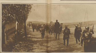
Zum griechisch-türkischen Konflikte. Griechische Infanterie auf dem Vormarsch