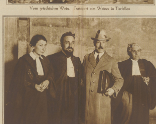
Die plenipotentiären. Der griechische Plenipotentiär (links) und der französische Plenipotentiär (rechts) während der Verhandlungen in Athen