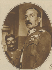
General Pando, der Führer der türkischen Truppen