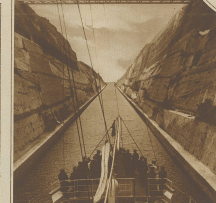
Zur Wiederrichtung des Kanals von Kani. Ein Schiff auf der Fahrt durch den Kanal