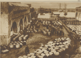
Vom griechischen Wein. Mächtige Weinstöcke im Hof von Kani auf Kreta