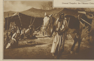
Zu den Ereignissen in Syrien. Ein mit den Truppen verbundene Zeltlager, dessen Truppen von den Franzosen nach ihrem Kavallerie-Vorstoß zurückgelassen wurden