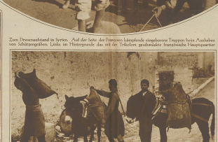
Zum Dreimächteabstand in Syrien. Auf der Fahrt der Truppen übersteigende Truppen über Anahel von Sidon nach Kani. Ein Transportwagen mit einem griechischen Kavallerie-Transportwagen