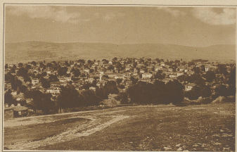
Zum griechisch-türkischen Konflikte. Bild auf die belagerte Stadt Sidon, die von den Griechen besetzt wurde