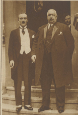
Die plenipotentiären. Der griechische Plenipotentiär (links) und der französische Plenipotentiär (rechts) während der Verhandlungen in Athen