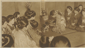
Das Leben im neuen Hause. Die junge Familie hat sich in der neuen Wohnung niedergelassen.