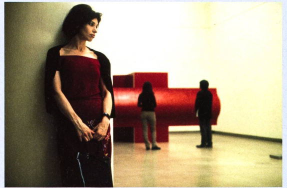
Béatrice Dalle dans «H Story» de Suwa Nobuhiro