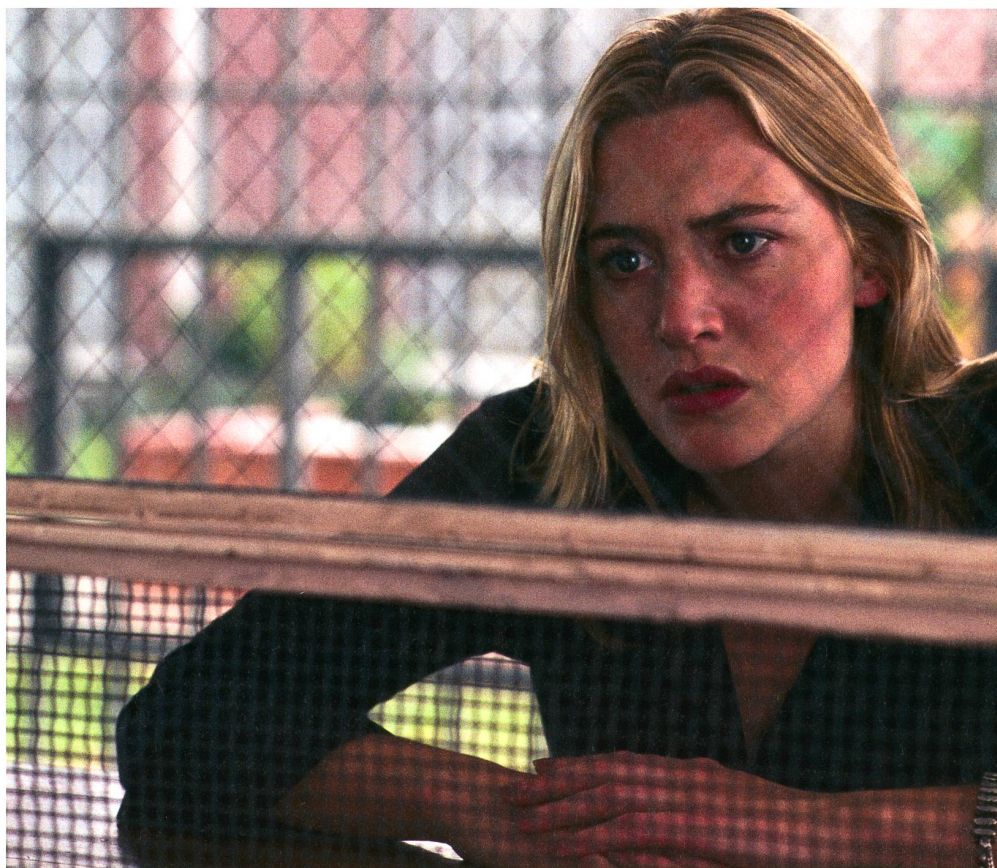
La journaliste Bitsey Bloom (Kate Winslet)