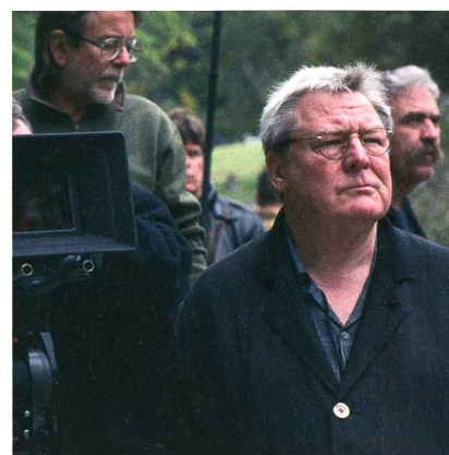
Le cinéaste anglais Alan Parker

Là n'est pas la question. Chaque forme d'expression peut avoir un impact émotionnel très fort sur le public. Travailler dans le registre de la fiction ne signifie pas que vous ignorez la réalité de la situation. Bien que l'organisation Death Watch soit une pure invention de notre part, il n'en reste pas moins qu'il existe un tas d'associations comme celle-là un peu partout sur le territoire américain. Je ne filme pas la vie réelle, je la recrée à l'écran, là où les documentaires l'observent en profondeur. f