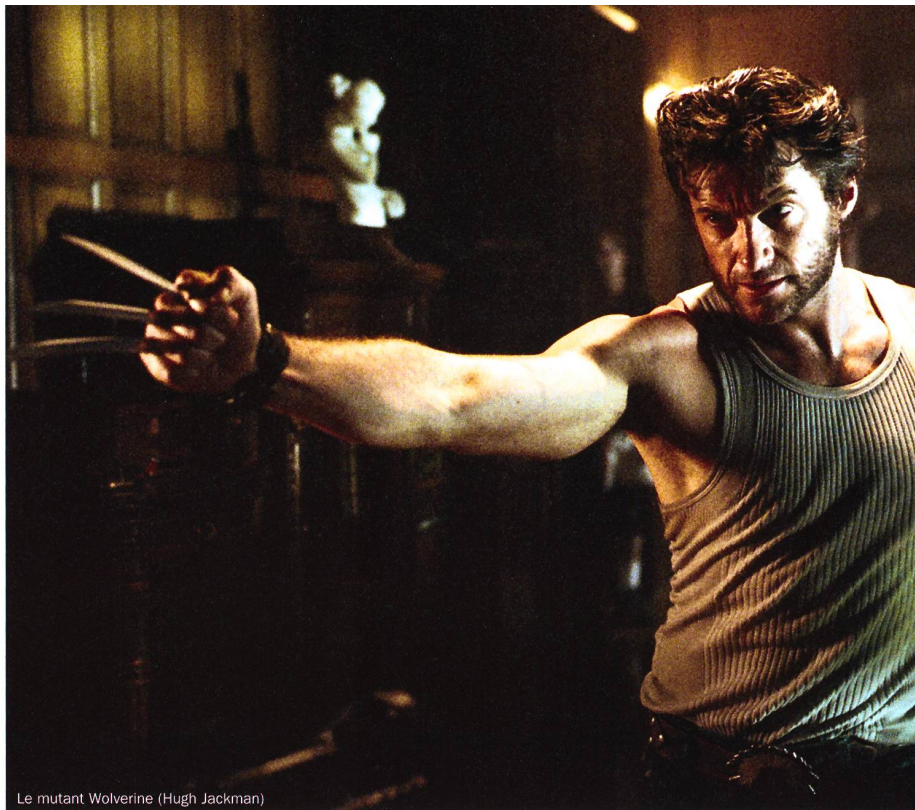
Le mutant Wolverine (Hugh Jackman)