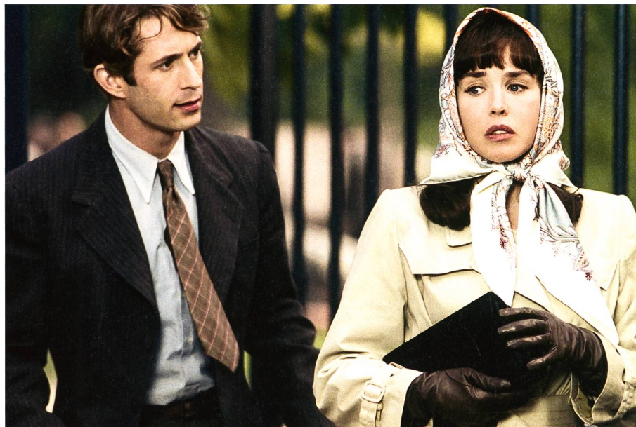
Viviane Denvers (Isabelle Adjani) et son amour d'enfance Frédéric (Grégori Derangère)