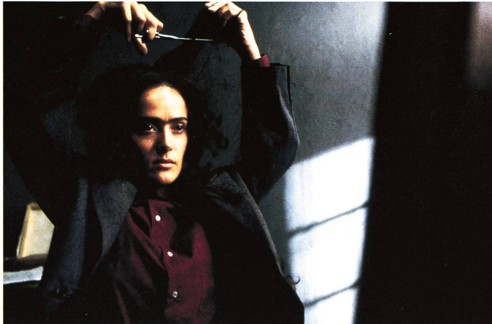
La peintre mexicaine Frida Kahlo (Salma Hayek)

la faute d'un André Breton qui s'est déplacé en 1938 à Mexico pour y découvrir ses peintures, «un ruban autour d'une bombe», se serait exclamé l'auteur du Manifeste! Même si elle admirait particulièrement Magritte, Frida a bel et bien élaboré son