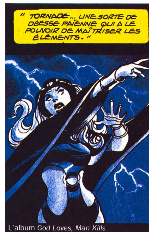
L'album God Loves, Man Kills

Base du scénario de «X-Men 2», cette aventure se concentre sur l'alliance des X-Men avec leur ennemi juré Magneto afin de lutter, non pas avec leurs pouvoirs mais avec leurs idées, contre un sénateur fasciste désireux d'exterminer tous. En vente dans toutes les librairies américaines ce mois-ci, la suite permet à Claremont d'accentuer encore davantage l'aspect dramatique. L'odyssée philanthropique des mutants n'est donc pas encore terminée... f