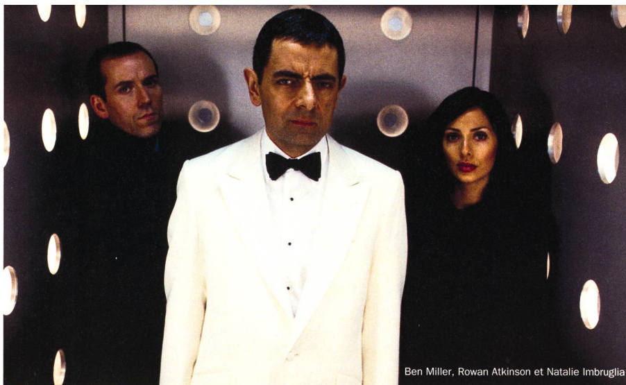
Ben Miller, Rowan Atkinson et Natalie Imbruglia