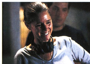
La cinéaste Julie Taymor

Stephen Daldry, Sam Mendes, Rob Marshall et aujourd'hui Julie Taymor: après des années sans transfuges notables, les temps semblent à nouveau favorables au passage de vedettes de la scène à l'écran. Pas plus que ses collègues, Julie Taymor n'est une pure novice, ayant fait ses premières armes à la télévision. Elle est aussi depuis vingt ans la compagne d'un des meilleurs musiciens de film actuels, Elliot Goldenthal («Heat», «Entretien avec un vampire», etc.), ce qui peut expliquer une