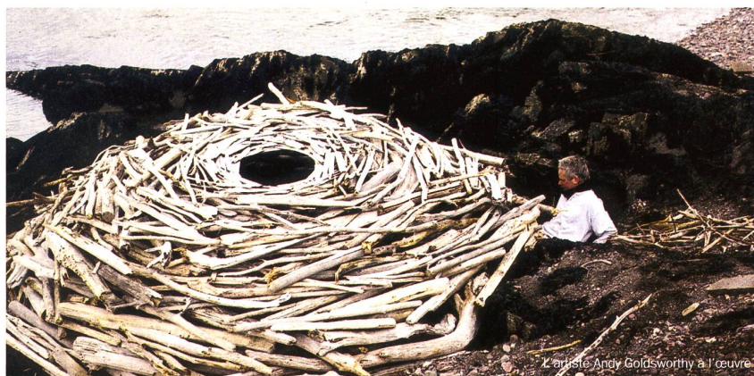
L'artiste Andy Goldsworthy à l'œuvre.