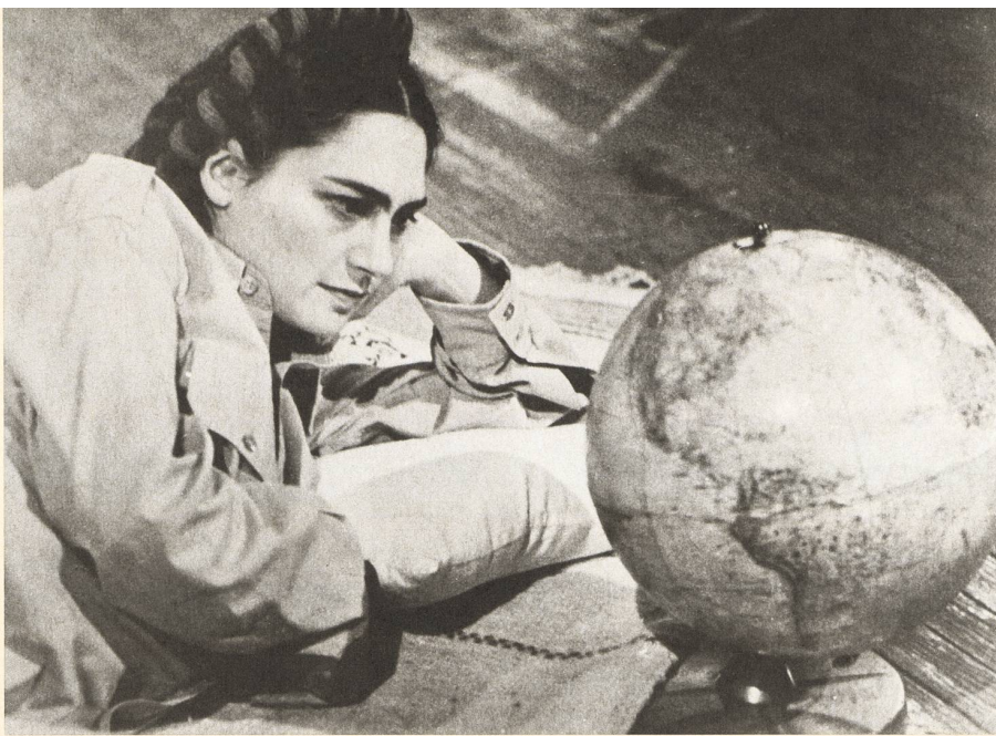
«Frida» du Mexicain Paul Leduc (1984). Un nouveau biopic sort fin avril