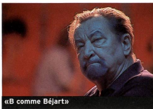
«B comme Béjart»