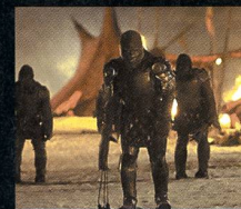
«La planète des singes» de Tim Burton