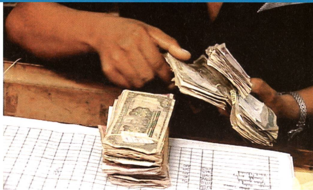
«Le profit et rien d'autre» de Raoul Peck

émission, les mêmes ingrédients et ressorts narratifs parce que c'est plus confortable – par paresse ou souci de l'audimat. A l'autre bout, il y a le «jamais vu» qu'on nous promet toujours, avec effets spéciaux à la clef... mais c'est en fin de compte décevant. A travers notre programmation documentaire, nous tentons d'organiser une pluralité d'expressions qui propose autre chose que ce déjà-vu; du nouveau qui ne prétende pas au sensationnel, mais qui entretienne les humains de l'humanité, de façon riche, complexe, unique.