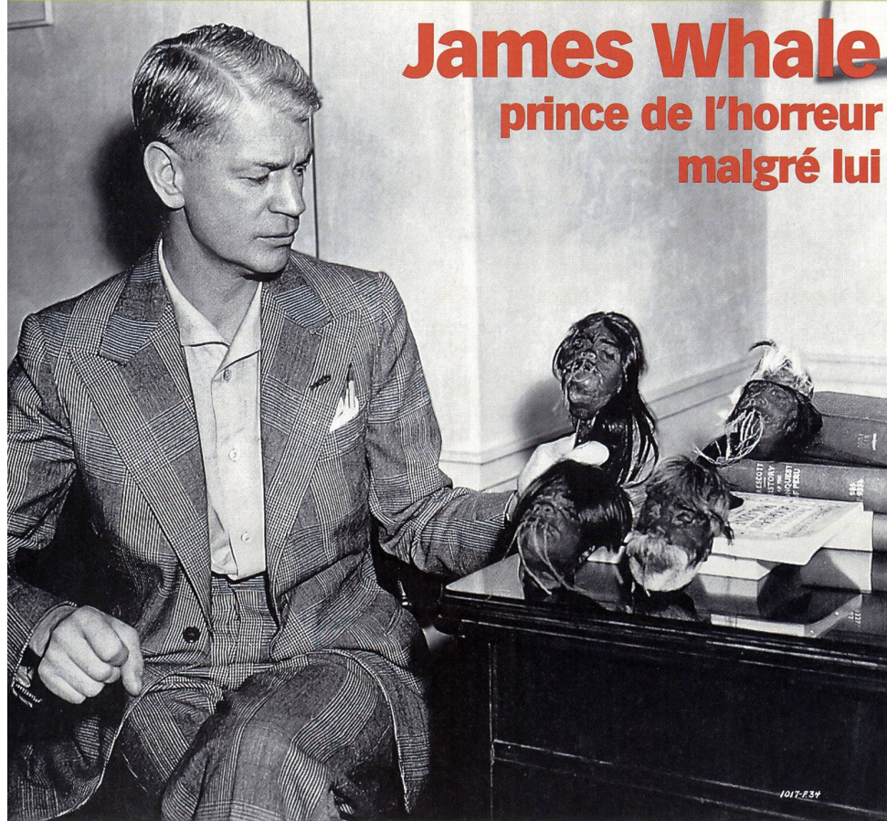
Le père de Frankenstein, personnalité troublante

Réalisateur dont la carrière se limite aux années 1930, Whale tourna vingt films. Né en 1889 dans une famille ouvrière anglaise de dix enfants, il se distingue tôt par son physique longiligne et son goût pour les beaux-arts. Engagé dans l'armée, il fait la première guerre mondiale en France et en Belgique. A son retour à la vie civile, il se passionne pour le théâtre et fait bientôt ses débuts d'acteur en mentant sur son âge et ses origines. C'est l'offre de mettre