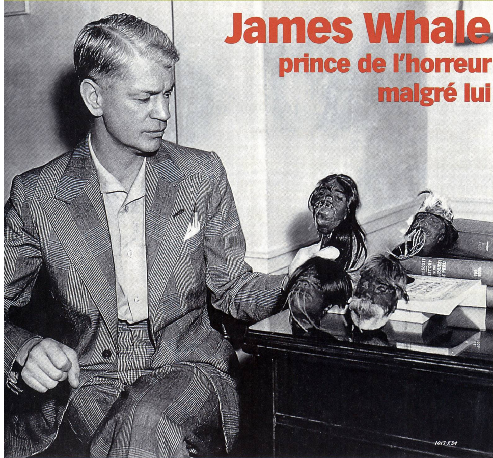
Le père de Frankenstein, personnalité troublante

Réalisateur dont la carrière se limite aux années 1930, Whale tourna vingt films. Né en 1889 dans une famille ouvrière anglaise de dix enfants, il se distingue tôt par son physique longiligne et son goût pour les beaux-arts. Engagé dans l'armée, il fait la première guerre mondiale en France et en Belgique. A son retour à la vie civile, il se passionne pour le théâtre et fait bientôt ses débuts d'acteur en mentant sur son âge et ses origines. C'est l'offre de mettre