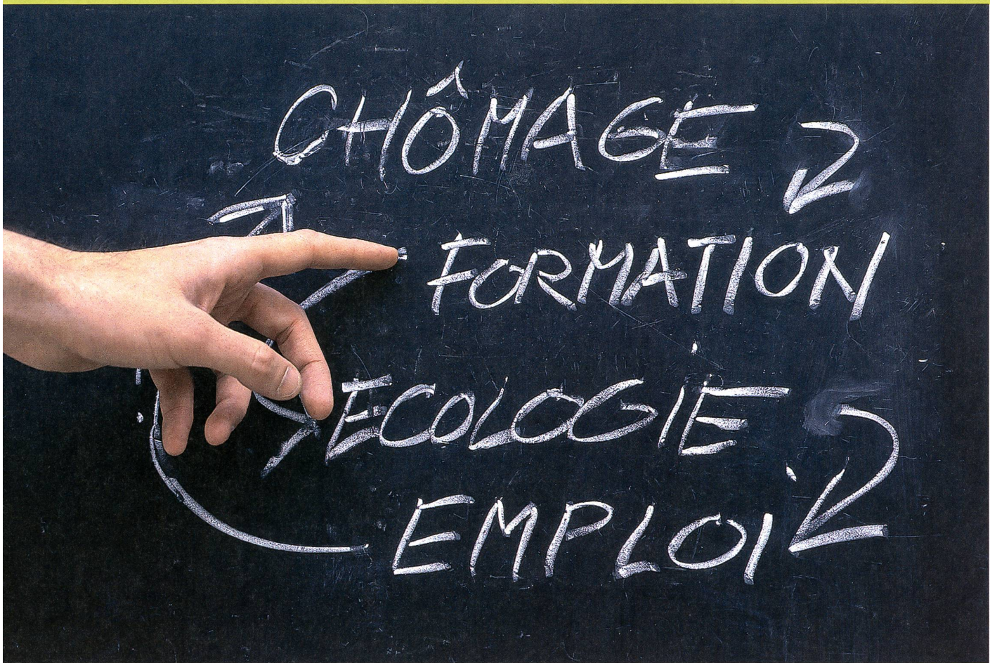
«Chronique d'une bonne intention» d'Alex Mayenfisch