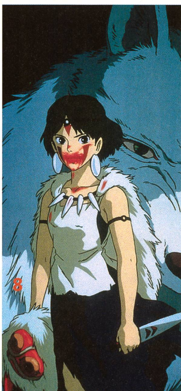
Lässt das ganze Spektrum der japanischen Zeichentrickkunst erahnen: «Princess Mononoke».