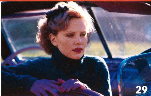
John-Irving-Verfilmung «The Cider House Rules»: Gelungene, emotional starke Leinwandadaptation.