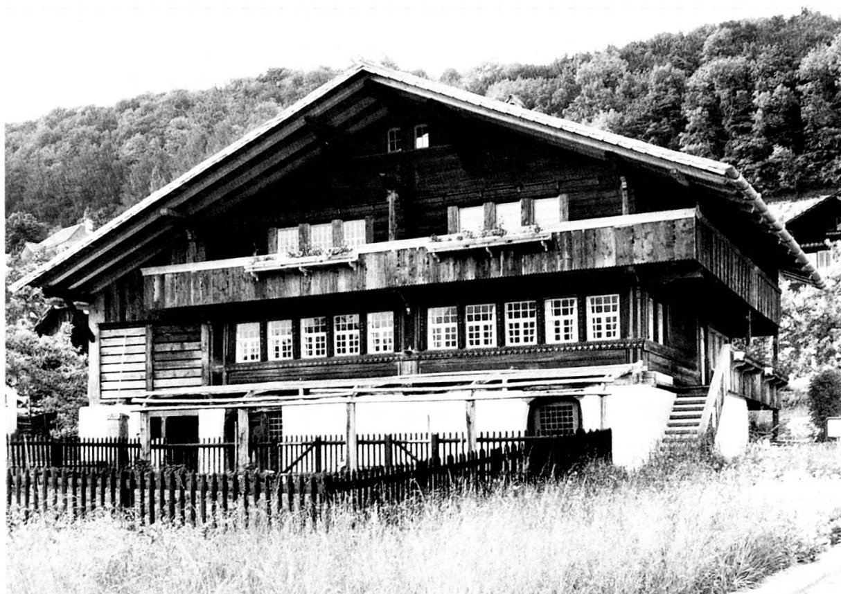
Spiez, Heimat- und Rebbaumuseum; Spiezbergstrasse 48, erbaut 1728, renoviert 1984/85.