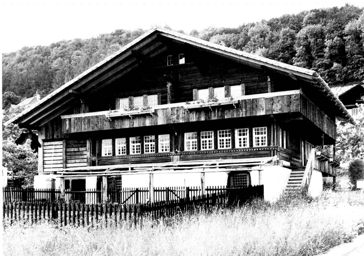
Spiez, Heimat- und Rebbaumuseum; Spiezbergstrasse 48, erbaut 1728, renoviert 1984/85.