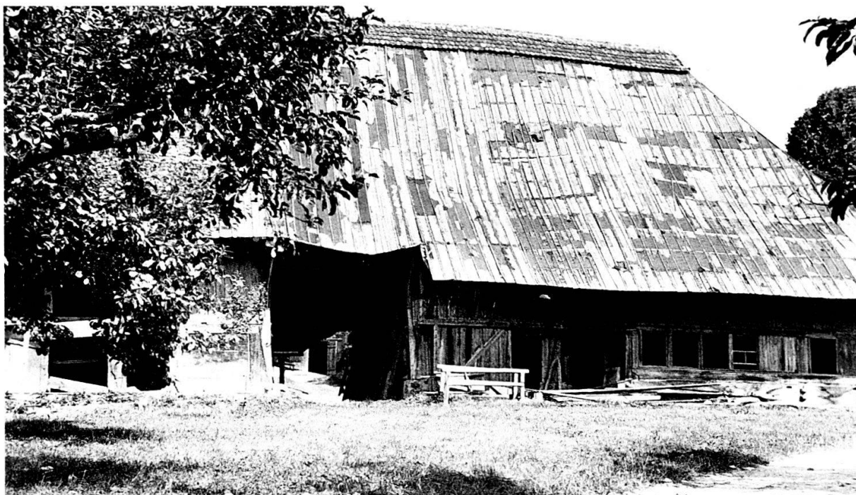
Das Bauernmuseum «Althus» mit einem Notdach aus Dachpappe, welches im Winter 1943/44 angebracht worden ist.