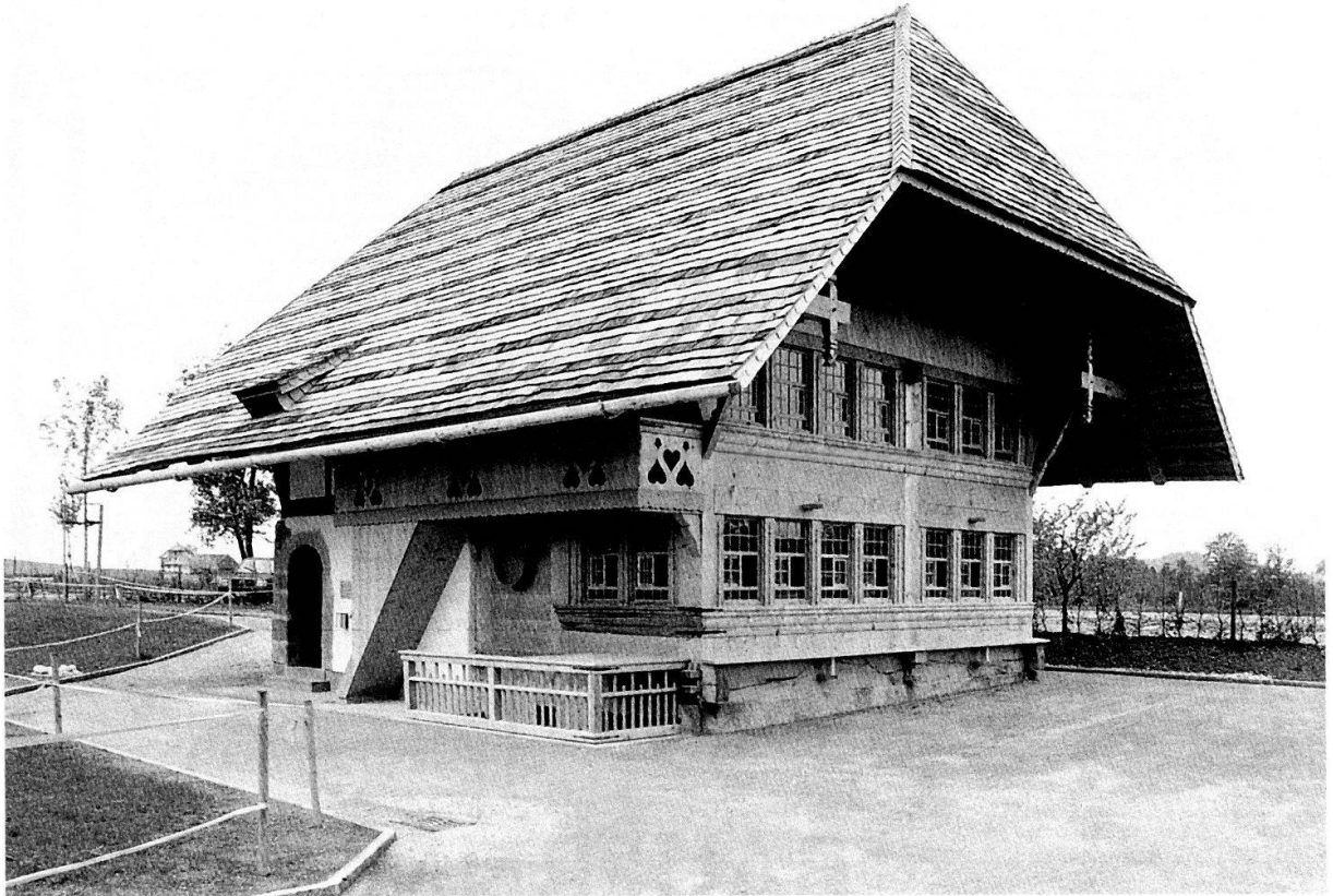
Affoltern i. E., Schaukäserei; ehemaliger Küherstock aus dem 18. Jh., 1990 wiederaufgebaut.

AFFOLTERN I. E., Schaukäserei: 1990 Wiederaufbau eines Küherstocks aus Waldhaus (Gemeinde Lützelflüh), Baubegleitung durch Randi Sigg-Gilstad. Ausstellungskonzept von Alfred G. Roth, Burgdorf.