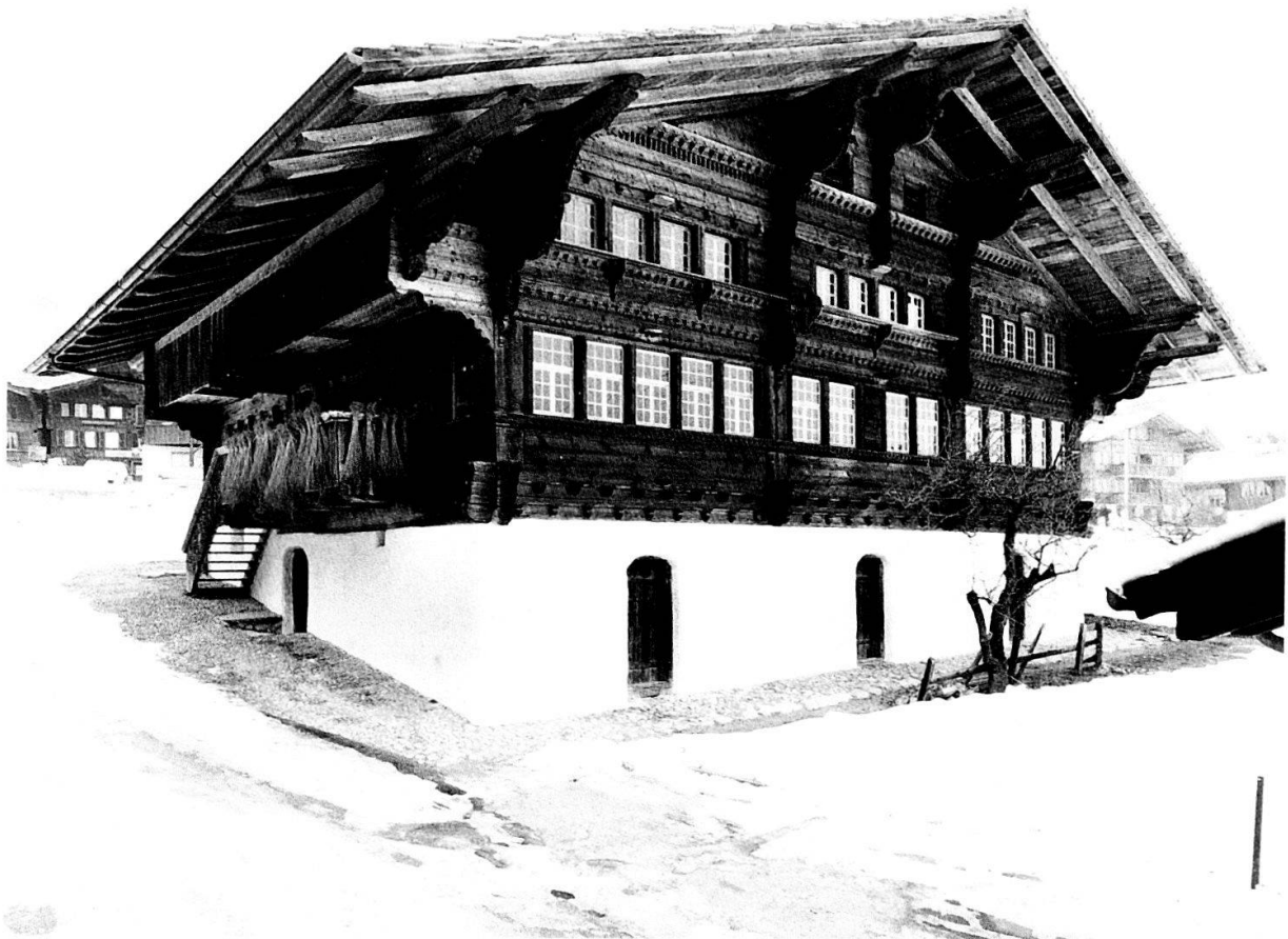
Erlenbach i. S., Museum der alten Landschaft Niedersimmental (Agensteinhaus); Nr. 321, erbaut um 1766, renoviert 1984/85.