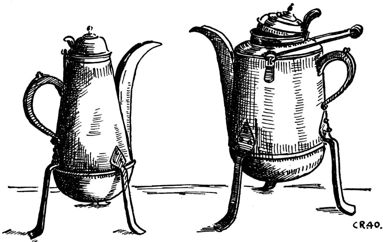
Abb. 22. Zwei dickbäuchige Kaffeekannen aus dem vorigen Jahrhundert. Diejenige rechts verwendete man hauptsächlich auf dem Felde draußen.

aus überbrochen ischt, mueß me no einischt aus uf d'Hütte tue u wärme. Da mueß de der Deerer ufpasser, u au Schyßbott chehre un es chlys Fүүr haa, süsch chönnt de die Sach i Rouch ufgaa. We ds Fүүr wott z'höoch wäärde, schlaat me mit em Gohn Wasser yche. E tummi Sach isch o gäng mit dem churze Zүүg, wo us de Buurdine useghüderet u de a der Böschig vo der Fүүrgruebe blybt lige. Ufs Maal brönnts u flüg uf. Drum wüsch me das Zүүg aubeneinisch mit dem nasse Bäse ache. Sött so ne Gatter verbrönne, das gieng de i ds Gäud, wil mängisch e Viertu oder e Fүftu druffen isch. Ds Überbräche rütscht de albe. Die Räschte Tingu sy grad druus. Jetze wird e Hamp-