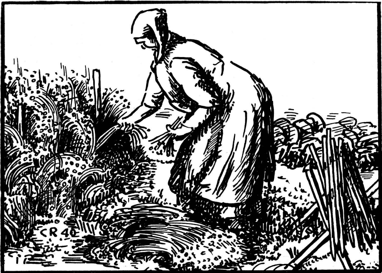
Abb. 20. Rosetti beim Flachsziehen (August 1940).

Jetze nimmt me der Chübu i ei Hang, louft zmits dür die erschi Sattelle u laat ei Hampfele Saame nach der angere dür d'Finger loufe. Het mes i ei Wääg gsäit, so faat me uf der angere Syte aa u säit o i de churze Sattelle. Der Flachs mueß me früech säie, hüür hei mer ne däich scho im Merze gsäit.