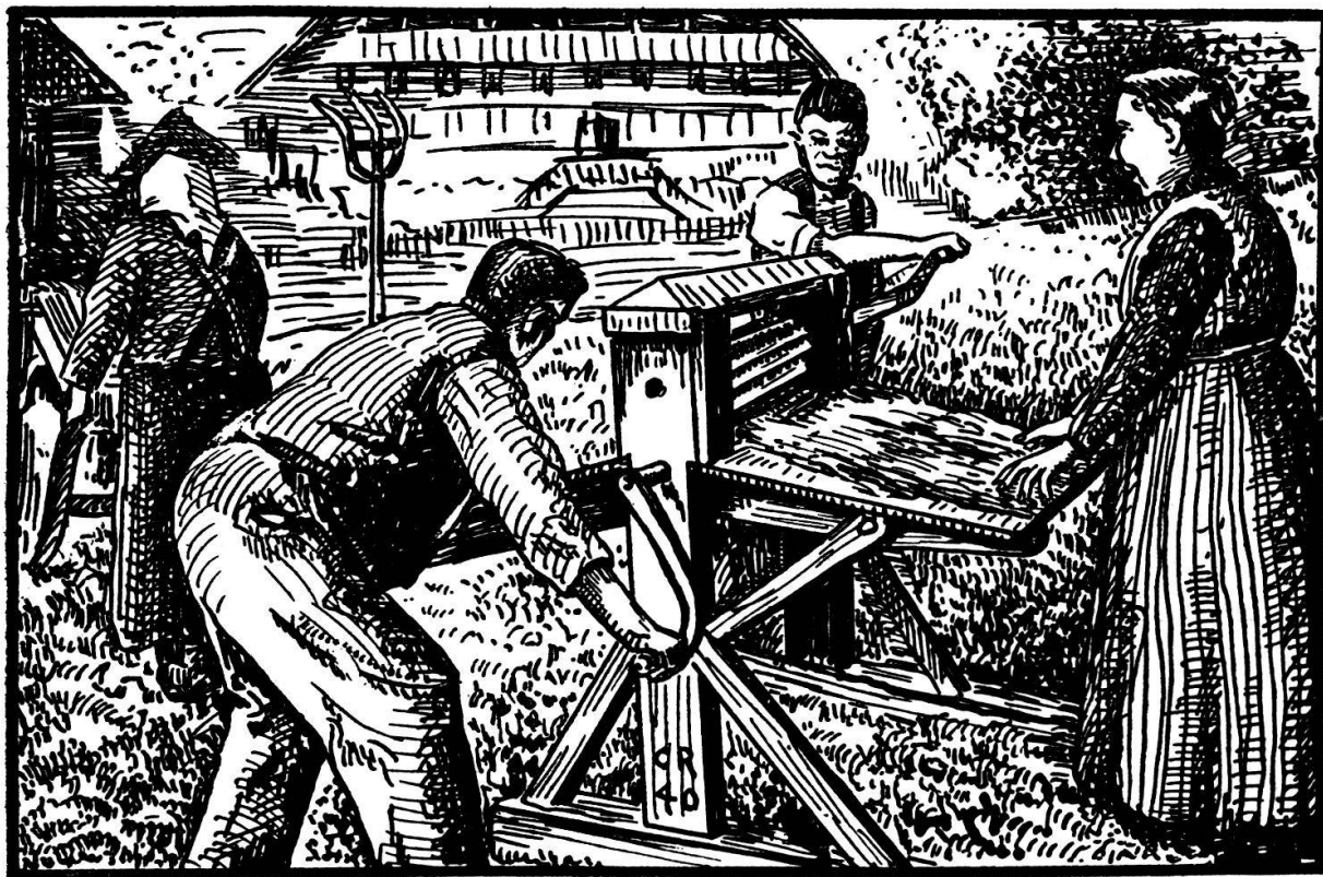
Abb. 21. Die beiden «Drückine» an der Brechmaschine.

De wird gfädnet. Was für Fade, as me da bruuch? Alle isch guet, wener nume hett. Der vorder Winter hei mer Chudergarn gspunne, mängisch het me alt Strümpf ufglaa. Die Fäde zieht me chrüzwys vo eim Stäckli as angere.