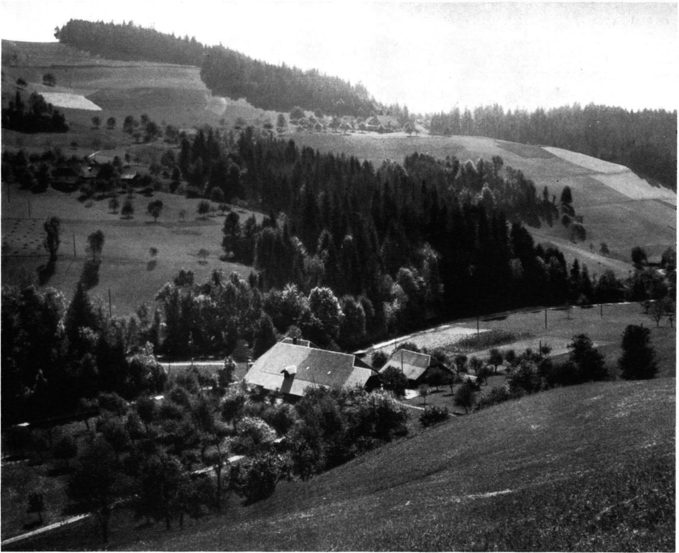
Die Hofsidlung vom Birbenwald herunter. Dem jenseitigen Hang entlang führen Bach und Strässchen : Eine Emmentaler-Landschaft in der Morgensonne.

Stöckli, Speicher und Haus. Am Hange oben Sonnberg und Ritz. Im Vordergrund das Geissbühlsträsschen.