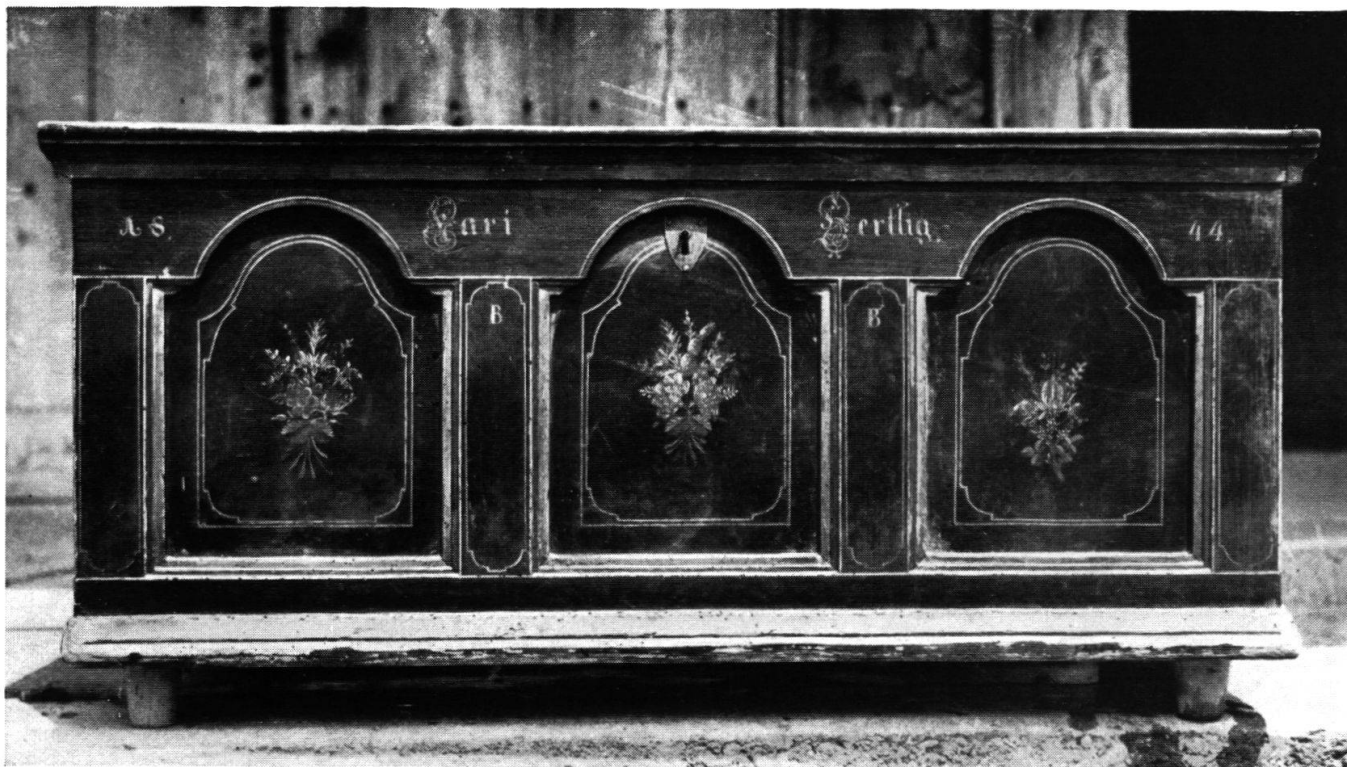
Biedermeiertrögli. Es ist 1844 dem 10 jährigen Karl Hertig geschenkt worden und enthält heute die prächtigen Tischtücher. Zwei reichbemalte Truhen aus dem Anfang des 18. Jahrh. befinden sich noch im mittleren Speicher. Sie bedürfen aber der Auffrischung, um photographiert zu werden.