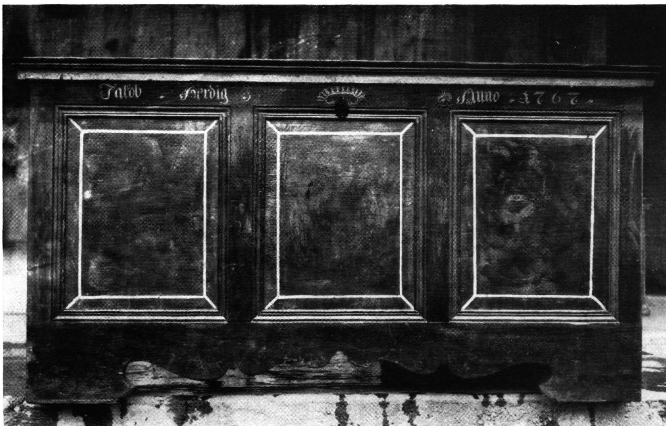
Diese Truhe ist 1779 vom Harrisberg her in den Frittenbach gezügelt worden. Sie ist auch heute noch angefüllt mit handgewobener Leinwand und steht im mittelsten Speicher.