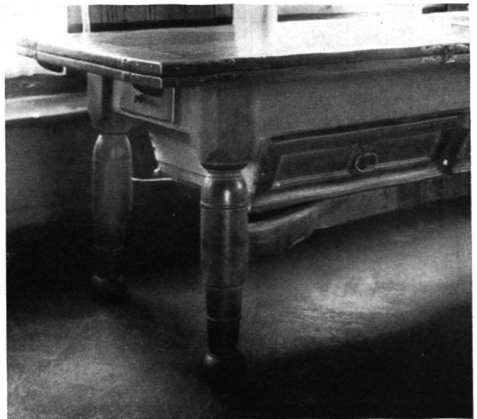
Der Familientisch aus dem Jahre 1792 ist ein Prachtstück seiner Art. Schreiner, Drechsler und Schmied haben hier beste Arbeit geleistet. (Siehe auch Abb. 2.)