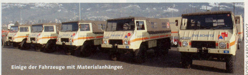
Einige der Fahrzeuge mit Materialanhänger.