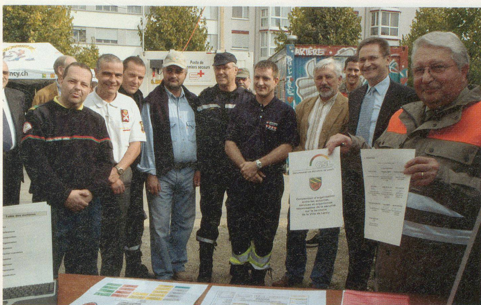
Tous les acteurs de la nouvelle convention liant les intervenants de la Sécurité de la ville de Lancy.