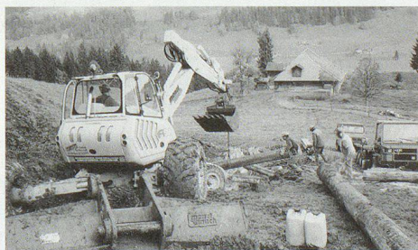
Mit Holzstämmen wird im Gebiet Untere Gemmi (Gemeinde Schangnau) ein neuer Bachlauf errichtet.

Das Unwetter vom August hatte auch im oberen Emmental beträchtliche Schäden verursacht. Die ZSO Region Langnau half bei der Beseitigung dieser Schäden: In der Woche vom 17. bis 21. Oktober standen 230 Zivilschützerinnen und Zivilschützer in Ein-