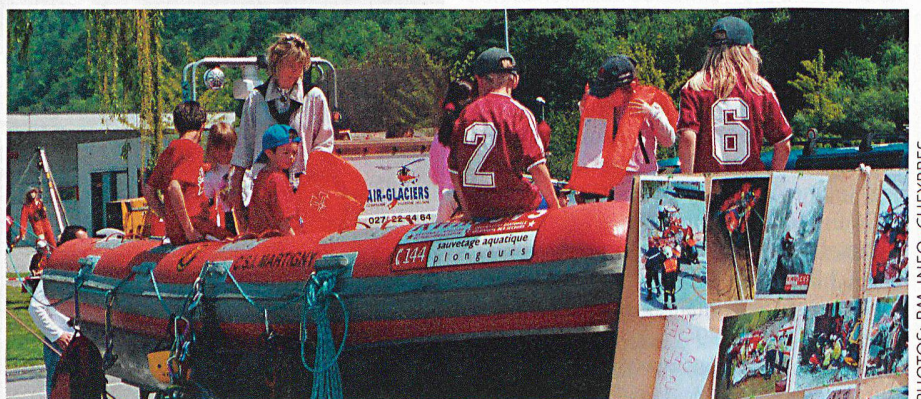
Le bateau des plongeurs du Bas-Valais.