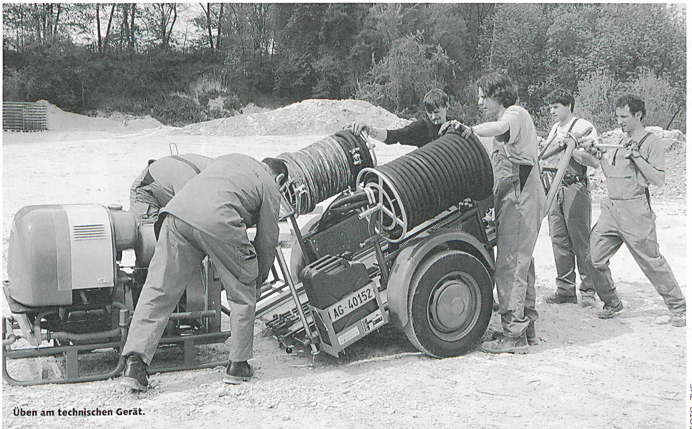
Üben am technischen Gerät.