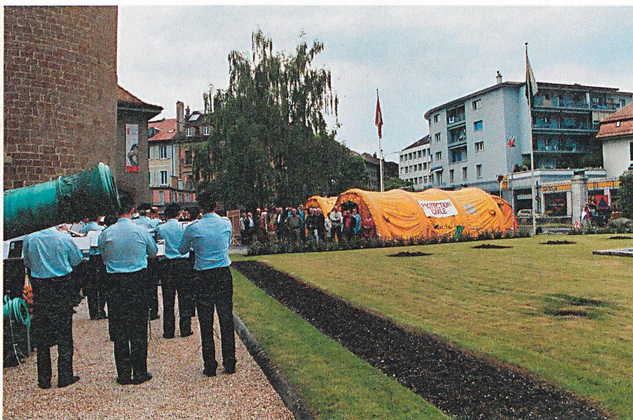
L'accueil des invités par la fanfare du SSCM.