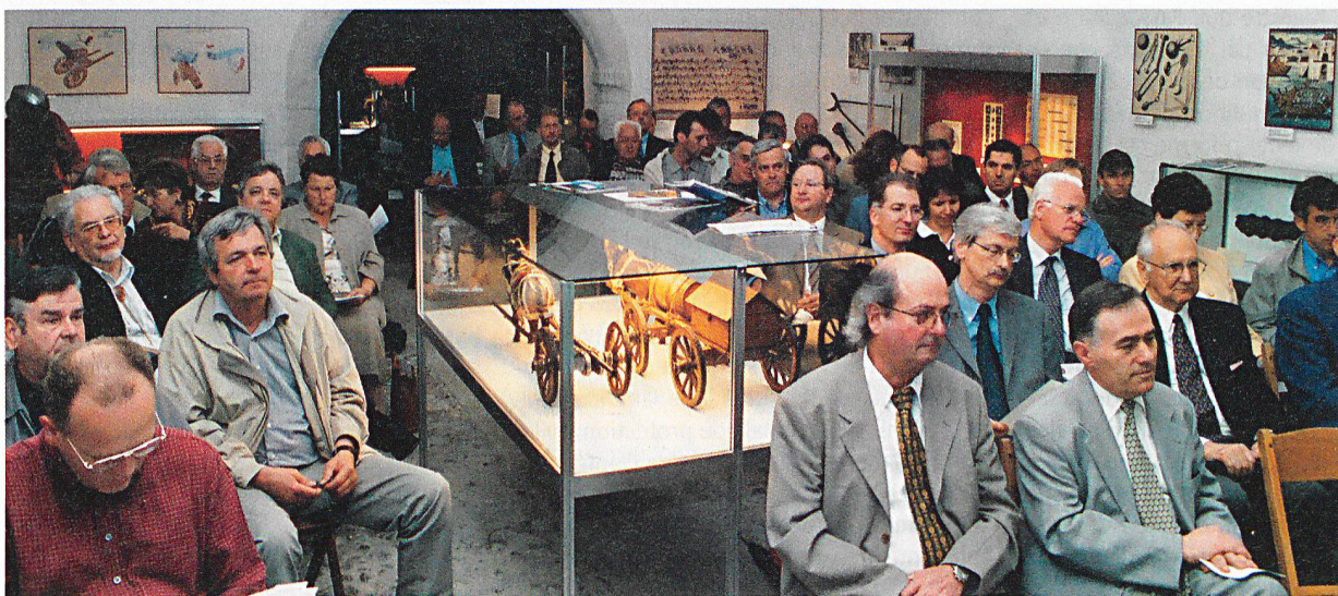
Les membres et les invités dans une des magnifiques salles abritant le Musée de l'artillerie.