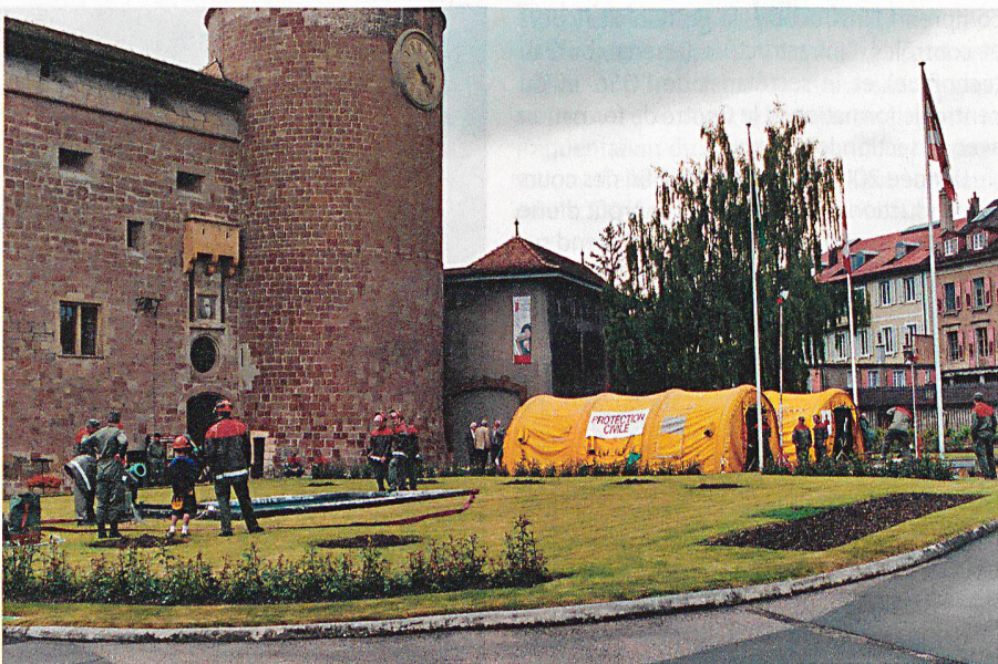
Vue générale de l'exposition.