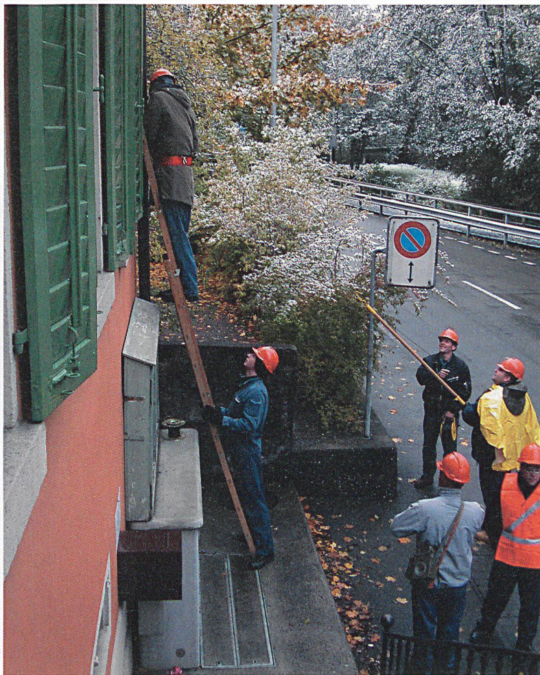
Die Zivilschützer der Führungsunterstützung beim Leitungsbau.

Der Wiederholungskurs war ein Erfolg; die Zivilschützer waren motiviert, und die gute Stimmung hielt den ganzen WK hindurch an. Ein Highlight darf nicht unerwähnt bleiben: das Mittagessen. Das Küchenteam verwöhnte die Zivilschützer jeden Tag mit einem ausgezeichneten Viergang-Menü! □