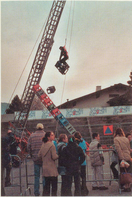
La fête bat son plein.