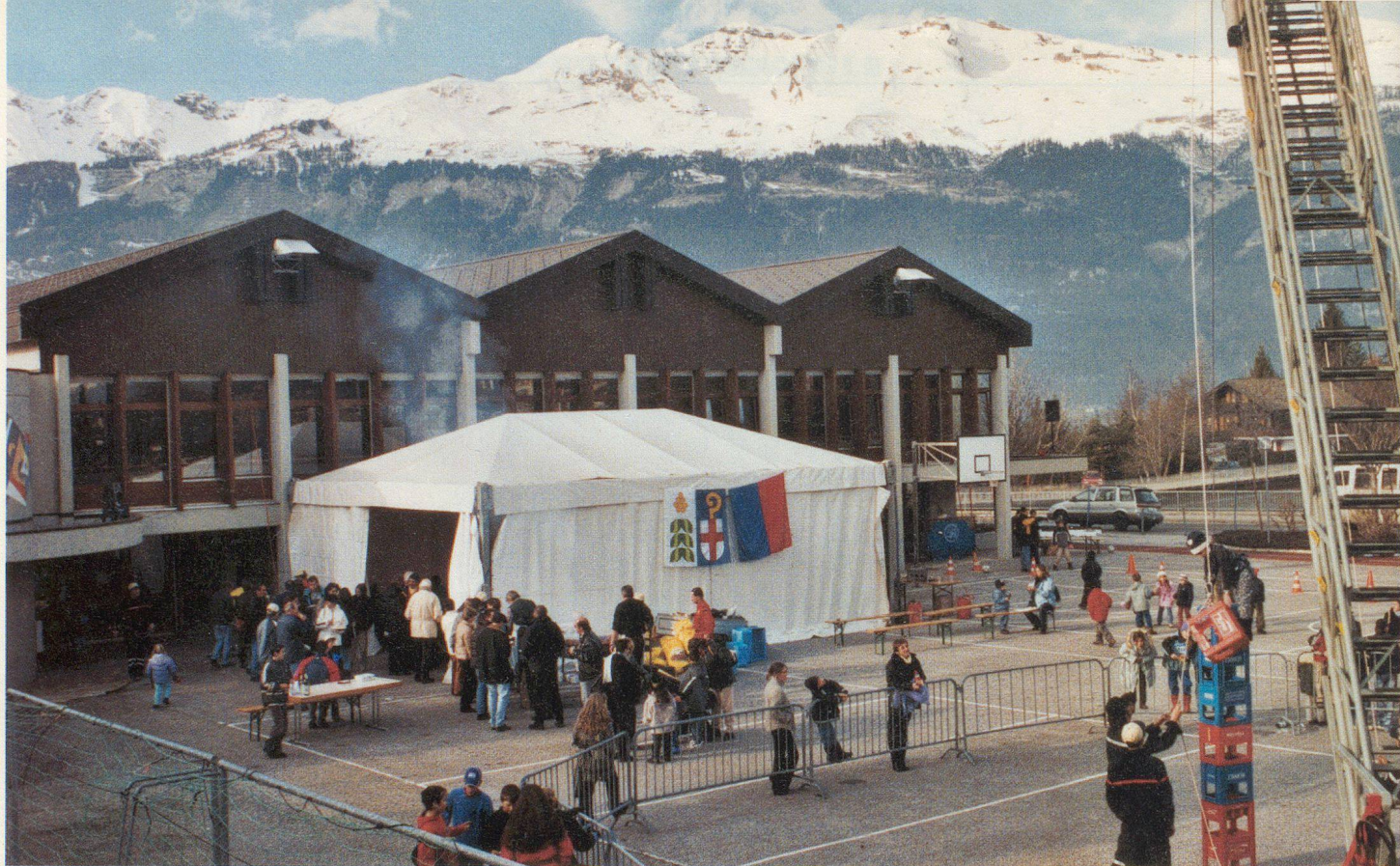
Vue générale de la place du Louché.