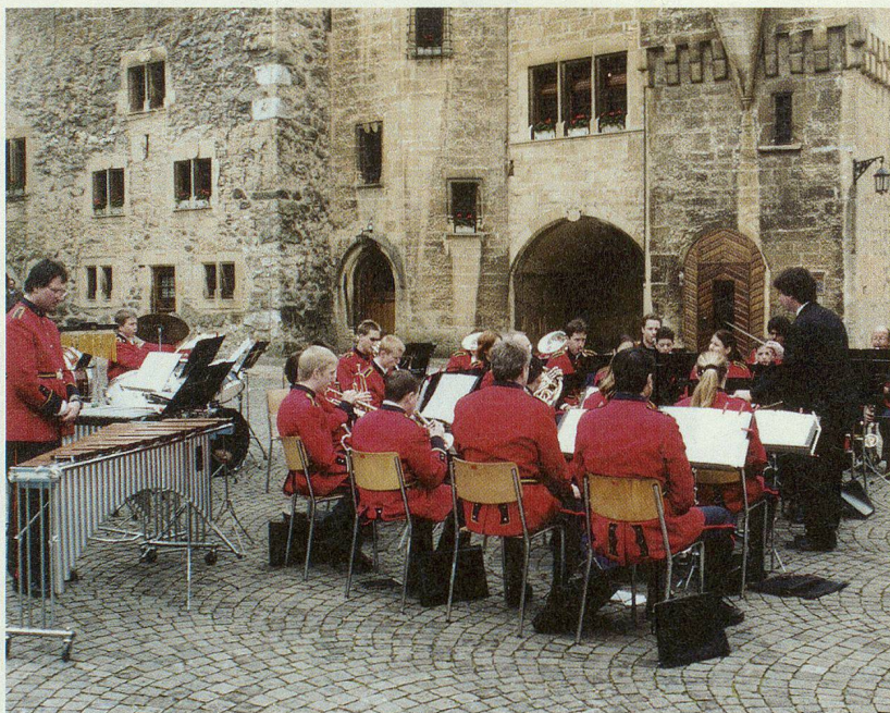
Die Musique militaire de Colombier konzertierte im stimmungsvollen Schlosshof zur Freude der Delegierten.

Romands brachten denn auch dieses Thema unter Traktandum «Verschiedenes» nochmals zur Sprache, woraus sich eine kurze, aber lebhaft, engagierte Debatte entwickelte.