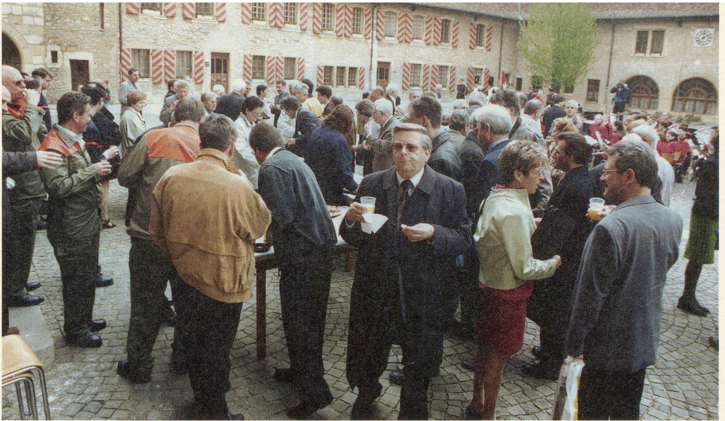
An Tranksame und an Essbarem hatten es die Neuenburger weder punkto Qualität noch Quantität fehlen lassen. Den Aperitif für die 100 Delegierten und Gäste gabs im stilvollen Schlosshof.