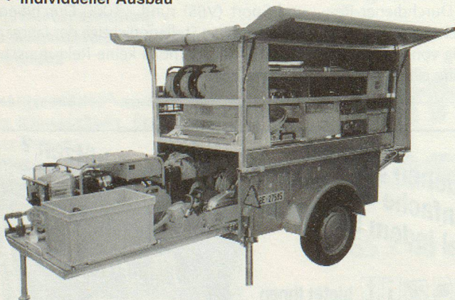
Superstructure pour remorque PC • Exécution individuelle