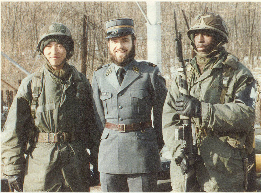
Gruppen- bild mit Body- guards.